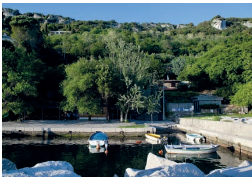
To je bil nekoč varen pristan ribiških plovil čup. Zdaj v njem rada pristane kakšna utrujena duša.