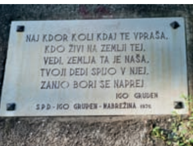
Tabla v pristanu, na kateri so vklesani verzi nabrežinskega pesnika Iga Grudna.

Gostišče je umaknjeno pod obrežno drevje. Pot k Pristanu pri čupah se spušča s kraškega roba po paštnah, terasah, vmes pa prečka tržaško cesto in železnico.