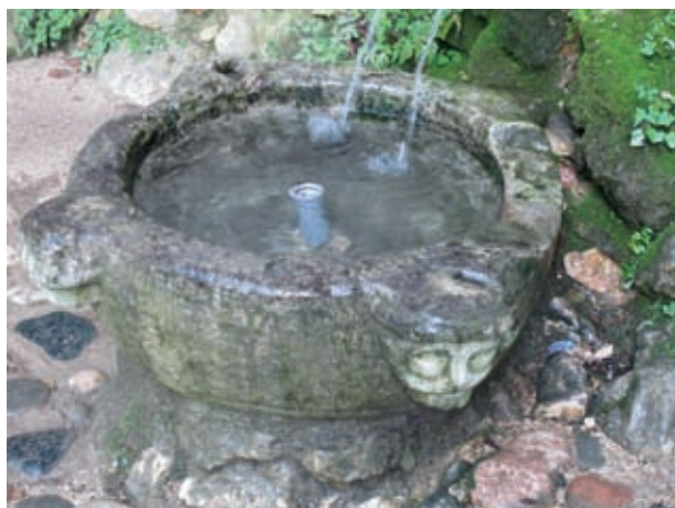
V keltsko skledo s štirimi izklesanimi glavami se steka voda iz Rozalijinega izvira.