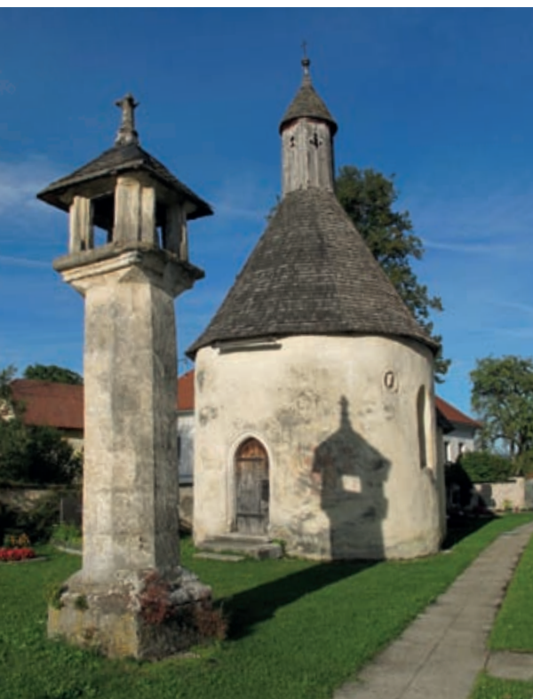
Gotski svetilnik za večno luč in kostnica na pokopališču v Globasnici, izjemna spomenika slovenske duhovne kulture

plotov na Peci, iz dolin Koprivna in Topla, ki so stoletja spadali pod globasniško župnijo.