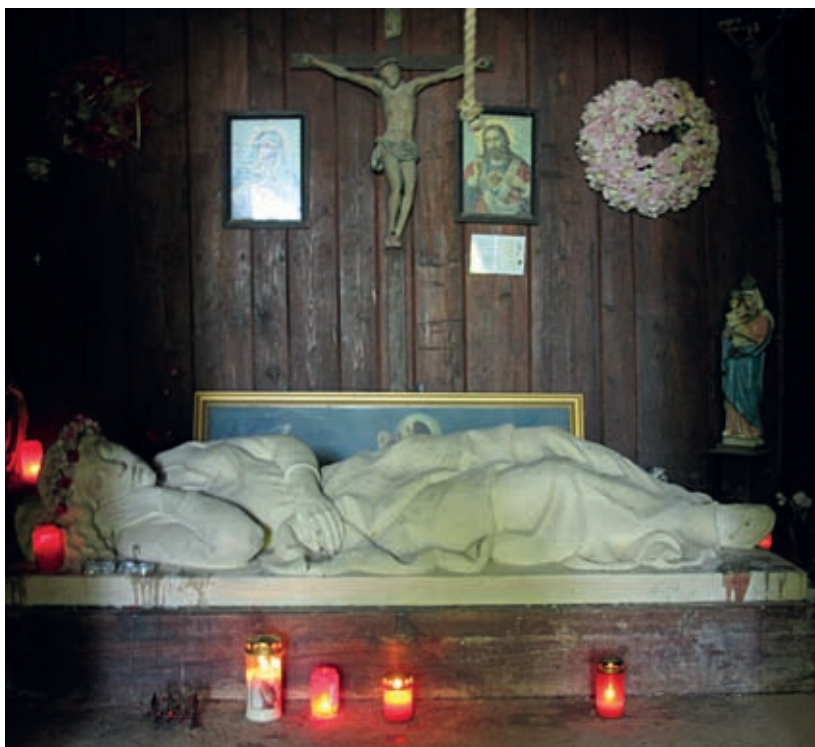
Marmorna Rozalija, speča v svoji votlini, cilj vse večjega števila romarjev in iskalcev zdravja.

Rozalsko žegnanje v septembru je danes pravo ljudsko slavje za vso Podjuno, vsem enako ljubo, tudi Koroščem z druge strani saintgermainskih