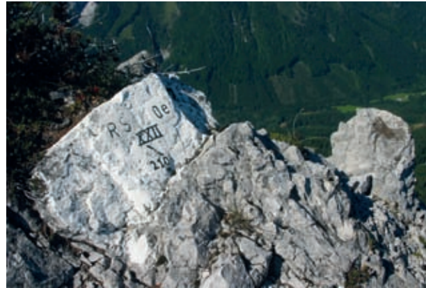
Na Jerebičju je meja začrtana kar po kamnih ali skalah, ki štrlijo z grebena.

Ko so si kmetje razdelili ves ta žuljavi raj, so najbrž rekli, naj nekaj ostane še za jerebice. Pripadnost domači zemlji je z Jerebičjem izravnala človeka in žival v skupnem domovanju. Prišlek v njem za nekaj ur doživi jerebičjost, plaho jerebičjo prvinskost, željo, da bi poletel.