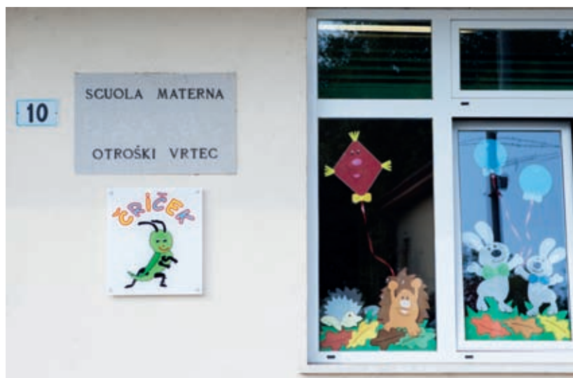
Nekateri malčki se šele v vrtcu srečajo z italijanščino.