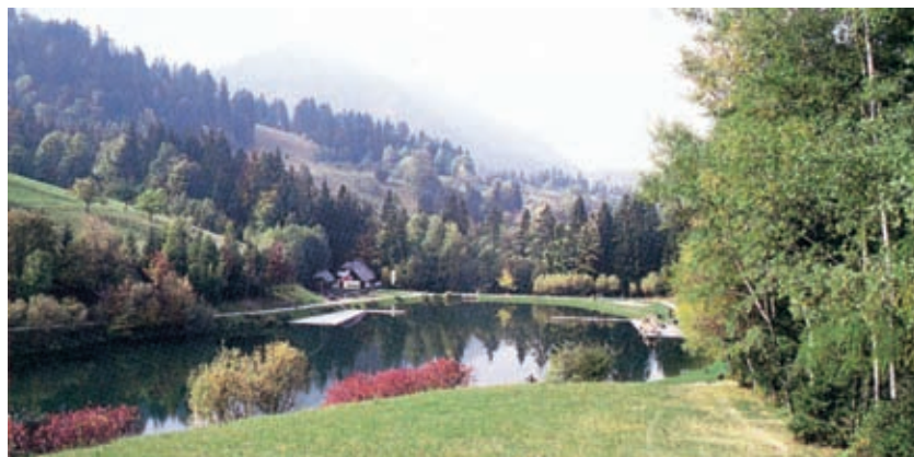
Ivarčko jezero na zaravni pod Uršljo goro, imenovano po kmetiji Ivartnik, kjer je najvišja postaja Vorančeve poti.