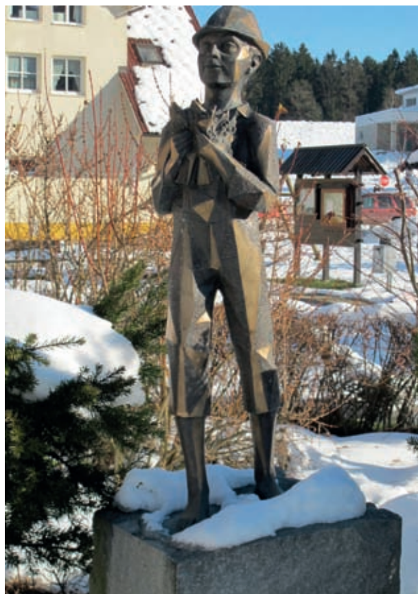
V Kotljah stoji bronasti Pobič s solzicami, prisposoda mladega Voranca, ki iz strašljive globeli Pekel prinaša materi šmarnice. Tudi ta kip je ustvaril Stojan Batič.

Na poševni planjavi nad bajto stoji dominanten pisateljev spomenik, tudi ta delo Stojana Batiča. Prežih se kot veliki bronasti duh razgleduje po svojem hotuljskem svetu. Od tam je le še kratka pot nazaj v Kotlje, na tisti prostor, kjer je življenje resnično hladno in mračno, na krajevno pokopališče, kjer ima veliki in nemirni pisatelj svoj večni mir.