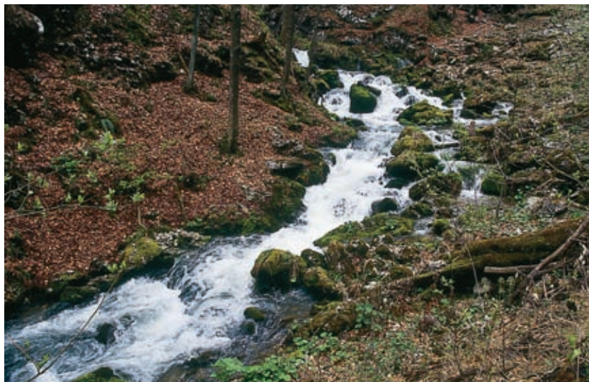
Poskočen, bister potok Ljubija je posebljenje Belih Vod.

smrekovško pogorje, ki ga je stresalo zadnje vulkansko delovanje na slovenskih tleh, na obe materinski koroški gori, Uršljo in Peco, pa še na Golte in vse valovito ovršje povirja Savinje in Pake.