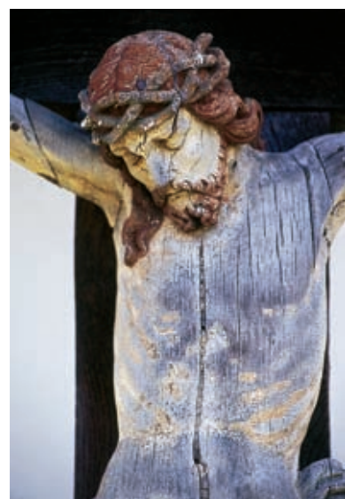
Križani z Belih Vod

Romarji, ki gredo danes okoli velikega oltarja, z zanimanjem opazujejo obrezano deblo, na katerem je nekoč stal oltarni križ. Takrat je lahko vsak romar od debla odrezal trsko, da bi ga povsod spremljala za srečo. Gneče pa danes razen za prvi maj, binkošti in nedeljo po godu sv. Ane (26. julij) ne bo občutil, čeprav nihče več ne roma na Sv. Križ ves dan peš. Cerkvi, ki ju je dal zgraditi blaženi škof Slomšek, sta večinoma zaprti, prav tako veliki romarski hiši in svete stopnice, po katerih so se spokorniki vzpenjali na kolenih in po katerih se, hudo zredčeni, vzpenjajo še dandanašnji ... Vse stavbe so obnovljene, kakor umite in polikane, okoli njih je obilo praznega prostora, poraslega s travo, tako da se izletnik mirno naužije širnega pogleda na