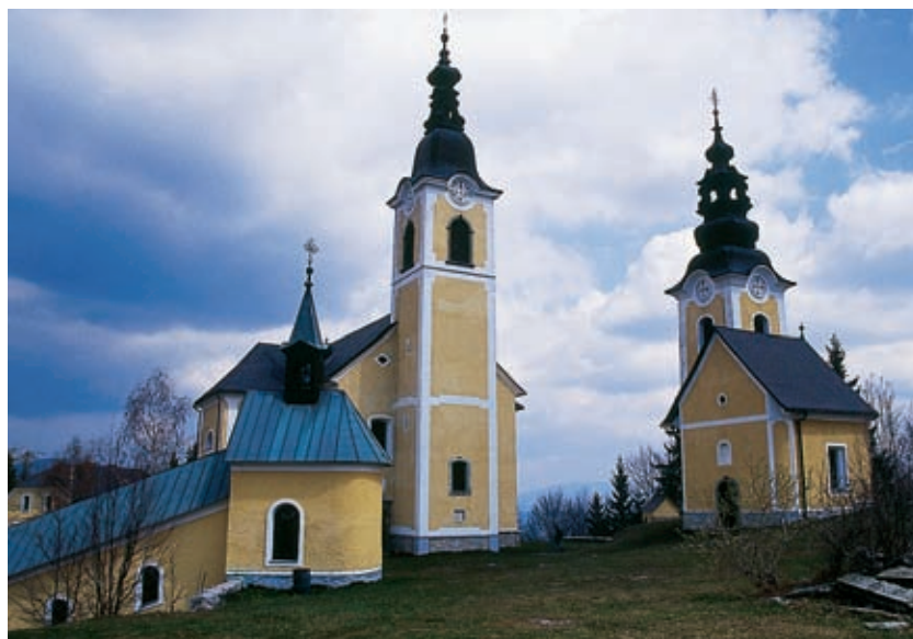
Romarski cerkvi na Sv. Križu je dal zgraditi škof Slomšek.

priključil vse gostejšim romarskim skupinam. Ob binkoštnih praznikih pritisne toliko štajerskih grešnikov, da jih pride do kakih pet tisoč po odpustke. No, Štajerce je Prežih imel rad v zobeh. Kakor da ni bilo grešnih romarjev tudi iz njegove Koroške. Štajersko ljudstvo prepeva dalje v noč. Med stojnicami je gneča, šum in vrišč, po gostilnah petje in razposajen vrišč. Ognji zaplapolajo okrog cerkve, okrog hiš in po gozdnem bregu, rumeni plameni, ki ugašajo in se spet vžigajo, ožarjajo razgrete romarske obraze. Na samotnih stezah urni, bežeči koraki ... po ozračju šepet, smeh in vriski dolgo v noč. Kakor svetel stožer se dviga vrh Svetega Križa visoko v nočno nebo iz globokih in črnih prepadov, ki ga obdajajo. V tak črn prepad so v davnih časih vrgli srditi romarji pregrešen romarski par, ki je šel spat za veliki oltar in se je ponoči, ko je mislil, da že vse spi, vdal pregrešni ljubezni.