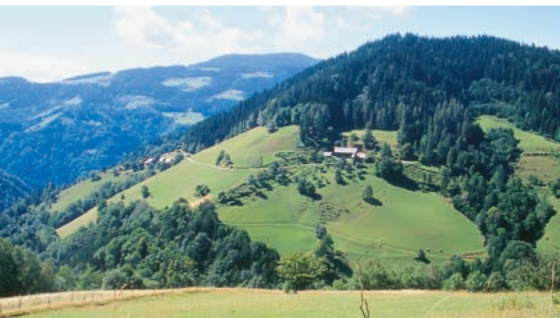
Pokrajina nad Muto z značilnimi samotnimi hribovskimi kmetijami, trdnimi in samozadostnimi, zgrajenimi na svojih celkih

Najboljše izhodišče za Jerneja je kar Primož, do katerega se z Mute pride po cesti. Še več, Primož je lahko izletniški cilj sam po sebi, še posebno tistemu, ki se k njemu z Mute potruzi peš po dolgem klancu, z višine 382 metrov na višino 807 metrov; pot gre po cesti in po nekaj označenih bližnjicah, uro hoda dolgo. Razgledi postajajo vse lepši, zdaj na Dravo, zdaj na Pohorje. Tista od daleč vi-