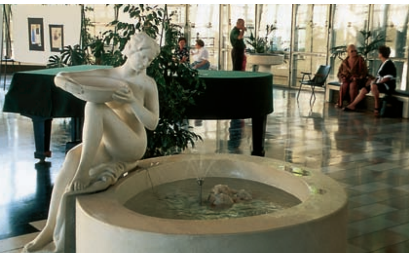
Pivnica slatine donat je lahko tudi salon, likovno razstavišče, prostor za komorne koncerte in sploh nadomestek znamenitega Wandelbahna, nekdanjega pokritega sprehajališča.

slave, skriva v zavojih pušpanovih grmičev njeno občutljivost in muhavost kakor v možganskih vijugah starega aristokrata.