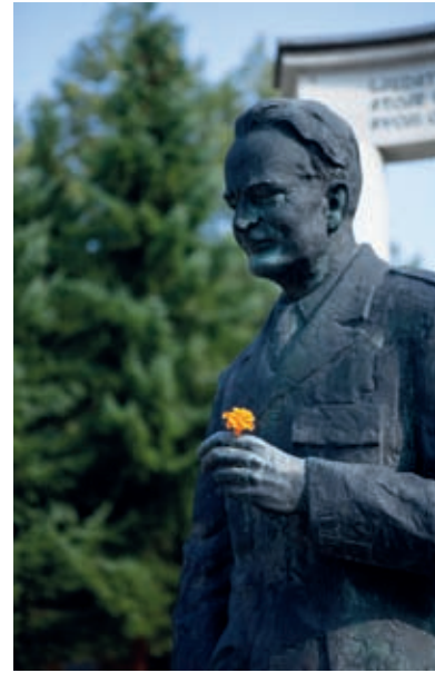
Kislo se držeči revolucionar Boris Kidrič pogosto dobi v roko rožico.

Če je vreme slabo, se lahko zadržite v ostanku starega pokritega sprehajališča iz leta 1843, nekdanj imenovanega Wandelbahn, kjer večkrat nastopajo glasbeniki. Tudi takrat bo prijetno, zakaj gore v ozadju zapirajo dostop hladnim vetrovom s severa in z vzhoda. Podnebje je tipično zmerno celinsko, zaradi velikih gozdnih površin zdravo in sveže, pretežno mehko in milo.