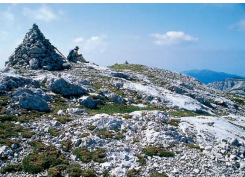
Poleti na Velikem vrhu nad Dleskovško planoto

Skozi pritake, vrata v ograjah, ki se sama zapirajo, teče tudi osrednja slovenska planinska pot. Do Kota, konca doline, se pot uro daleč blago vzpenja. Tam je Robanova planina (890 m), kjer lahko v poletnem kmečkem gostišču použijete še dobrote, ki jih tu pridelajo, zlasti nebeško dobro kislo mleko, ajdove žgance z ocvirki in domač kruh.