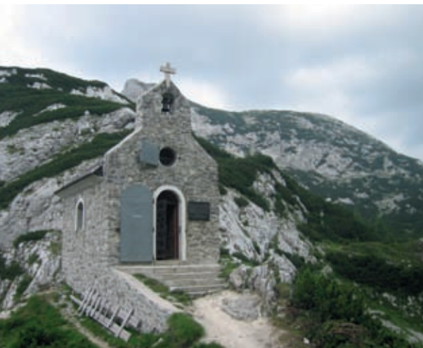
Kapelica na Molički planini, za katero je Sedelce, kjer leva pot zavije na Dleskovško planoto.