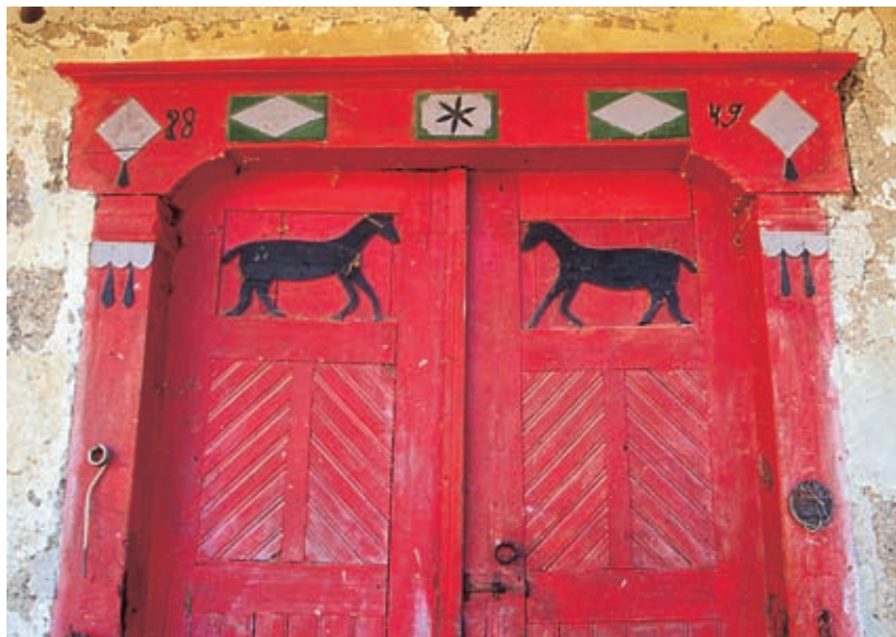
Okoli 165 let stara hlevska vrata pri domačiji Rihar nad Podvolovljekom

neutolažljivega velikana.) Do konca oktobra vas po njej ob vikendih pelje vodnik. Obiskovalcev je v tej najvišji turistično opremljeni jami v Sloveniji vse več. Po zaslugi preboldskega jamarskega kluba Črni galeb je v notranjosti skoraj nedotaknjena. Osvetljen je le vhod, večji del pa si je s kapniki – znamenitimi malgoniti, mehкими kapniki iz jamskega mleka, sestavljenimi iz igličastih kristalov kalcijevega karbonata, ki spremenijo obliko že na najrahljši dotik – vred treba ogledati s karbidno svetilko v rokah. Velik del notranjosti je še neraziskan. Bomo še videli, kako globoko k sebi bo jamarje spustil velikan z Raduhe. Če jih bo čisto na koncu čakal le počen lonec, bodo vedeli, da je jamarske povestice pač konec.