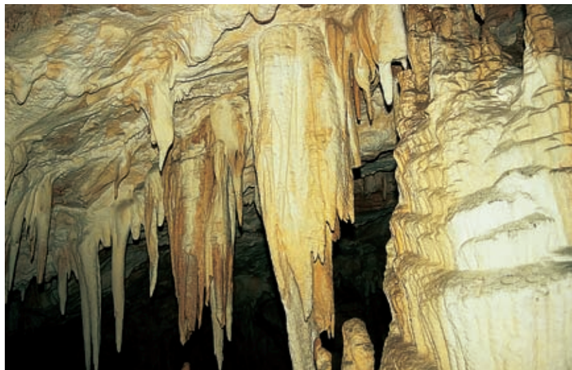
Snežna jama. Više ležeče jame, ki bi bila opremljena za obisk turistov, v Sloveniji ni.