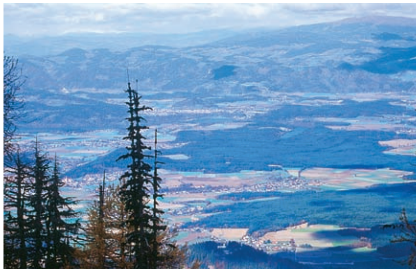
Z gore Topice se lepo vidi v Podjuno, še zlasti na podjunska jezera, in naprej na Pliberško.

pisateljski mojster Florjan Lipuš. Hudi so le jagri, ki prepovedujejo vožnjo po njihovi cesti, lepo speljani skoraj pod vrh. »Če pa bi na silo hoteli prevoziti namesto prehoditi pot na goro, kaj bi ostalo od planinstva?« je prijazno rekel neki drvar, ki je znal ne samo spretno sukati žago, ampak tudi lepo ravnati s svojimi čebeljimi panji, ki jih je bil pripeljal na gorsko pašo. »Med temi jagri so tudi burši,« je opozoril s stišanim glasom in se plašno ozrl okoli sebe. Z burši je mislil brambovce koroškega nemštva. Ali je iz njegovih oči odseval strah? Njegova zaklenjena duša? Spomnil sem se, kaj je rekla mlada slovenska koroška političarka. »Naši so že veseli, če se jih neha tepsti.«