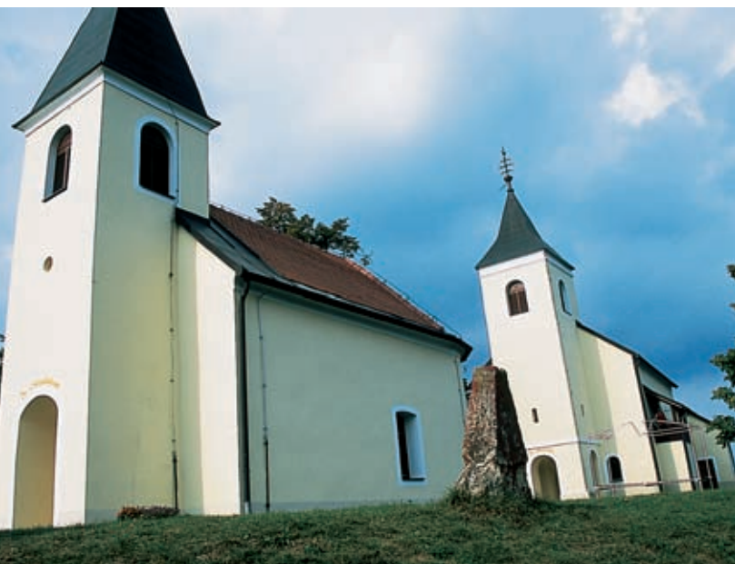
Magdalena in Avguštin, cerkvi dvojčici, pred njima star mejni kamen med Avstrijo in Ogrsko, ki je spet prišel prav.