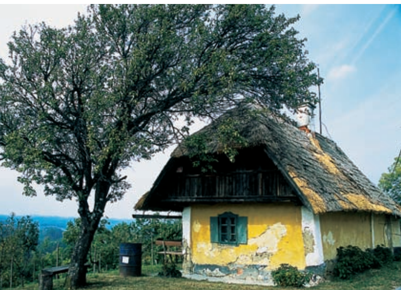
Nekdanja viničarska domačija na Malem Okiču

Umetniško navdihnjeni domačin se je slikarsko in pesniško izpovedal na steni svoje hiše.