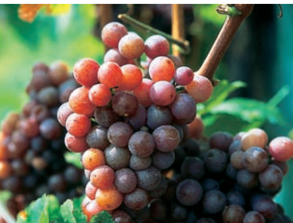
Grozdi, ki dozoriijo v najbolj srečnem mesecu Haloz.

zemeljska piramida, večja od Keopsove. Za varen občutek, da gledate pravo cerkev sv. Avguština, dodajmo, da ima ob sebi še cerkev dvojčico, ki pripada sv. Mariji Magdaleni. Četudi obnovljeni, izdajata, da ju niso gradili arhitekti, ampak preprosti domači zidarji, ki jih niso skrbeli proporciji in simetrija. Zgodovina ne sporoča, kdo se je domislil, da visoki prostor, ki vrši od pritajene zemeljske energije, posveti svetnikoma, ki sta si nenavadno daleč, hkrati pa še bolj nenavadno blizu: vélikemu mislecu, ki ima tu edi-