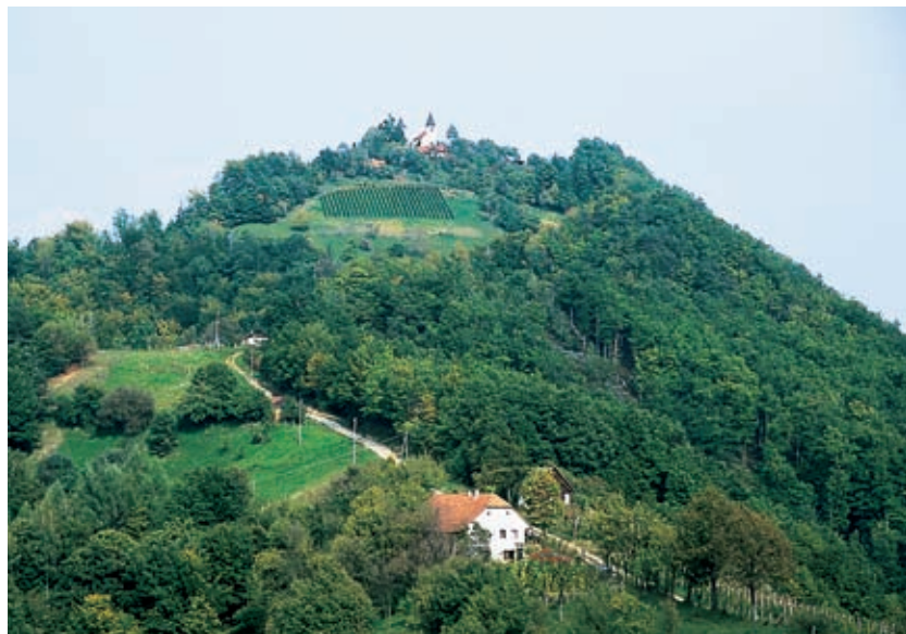
Na Avguštinov hrib nad Veliko Varnico, kjer tik ob meji s Hrvaško stojita romarski cerkvi sv. Magdalene in sv. Avgušтина, vodi ozka, strma cesta, po kateri se je najbolje podati peš.

kmetijski strokovnjaki sodijo, da ima samo pet odstotkov svetovnih vinogradniških površin tako ugodne klimatske razmere za pridelavo vina kot Haloze. Po količini tu vodi laški rizling, po kakovosti pa je kralj renski rizling, katerega imenitni dvorjani so rulandec, zeleni silvanec, traminec in rizvanec. Ta dvor seveda ne more delovati brez komornika haložana, ki je plemeniti bastard laškega rizlinga, šipona, belega pinota in sovinjona.