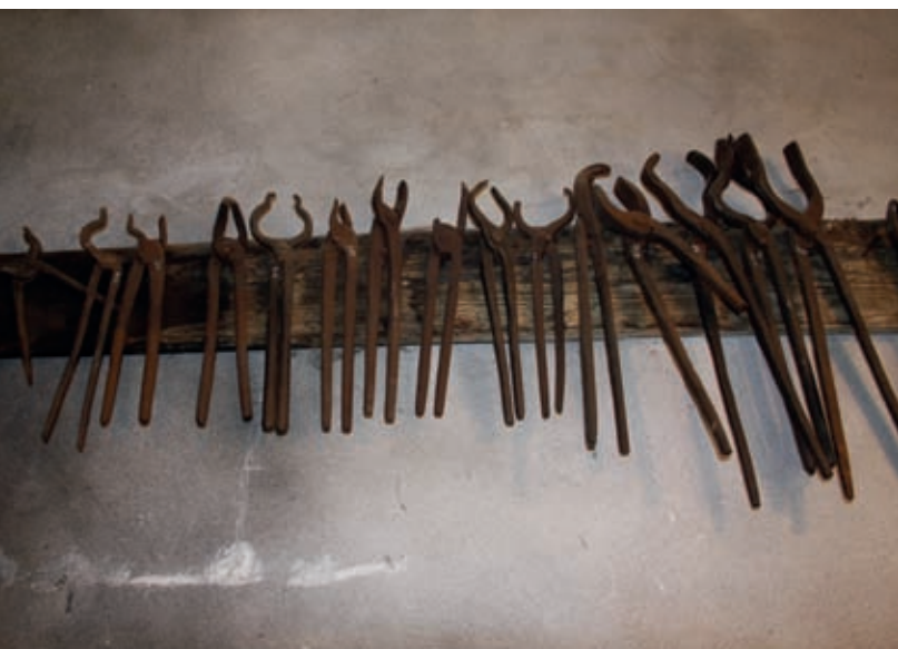
Kovaško orodje v muzejski delavnici v gradu

kastelologi bodo morda dobili potrdilo o tem, okoli katerega gradbenega jedra je sploh zrasel razsežni in razkošni dvorec. Z odkopavanji se počasi odgrinjajo podatki o njegovem razvoju. Tako je na primer že prišla na dan napol strohnela klada z okovjem za priklepanje jetnikov. Lahko si jo ogledate v grajski muzejski zbirki.