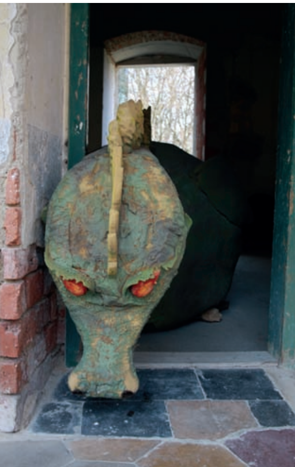
Prvak med demoničnimi grajskimi bitji je zmaj ...

... zaležejo pa tudi coprnice vseh vrst.