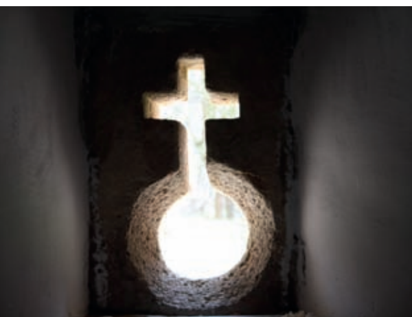
Strelnica v grajskem zidu