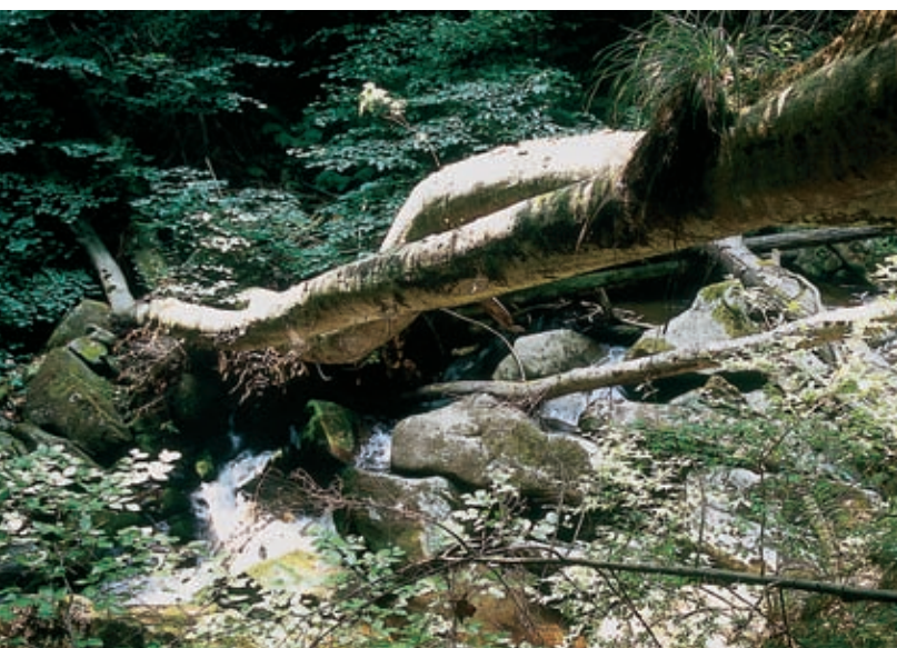
Soteska Bistrice se ponekod spreminja v sekundarni gozd.