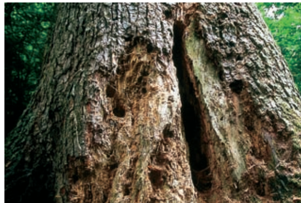
Od skoraj mrtvega drevesa živi na tisoče in tisoče bitij.