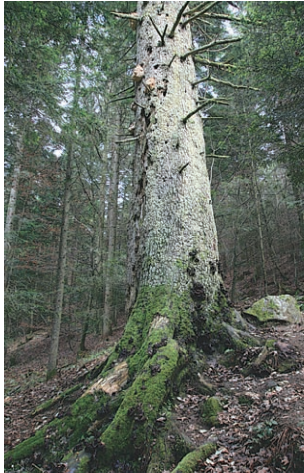
Maroltova jelka, morda najširše drevo svoje vrste v vzhodnih Alpah