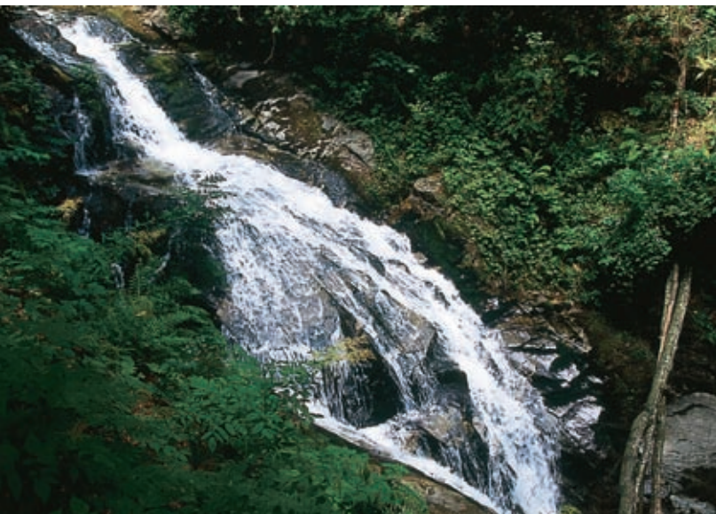
Slap Šum v Bistriškem vintgarju

jezikov bi vam v Bistriškem vintgarju lahko izšepetal ta duh, koliko vesolja in jeze nad to isto bistrico, ki je zmeraj enako pretočna, sveža in pitna! Kakšni so bili rimski sužnji, ki so iz skladov lomili velike kose belega marmorja? Kakor luknji iz lobanje strmita v izletnika dve velikanski dupli iz namrgodene zelenorjave stene Rimskega kamnoloma. Vlaga je povzročila poroznost marmorja, bele metamorfne kamnine, nastale s prekrystalizacijo apnenca. Da je kamnina res bleščeča bela, po videzu gosposka kakor na šempeterskih rimskih nagrobnikih ali Orfejevem spomeniku na Ptuju, boste videli na skladih po stenah kamnolomnih jam, ki so se prelomili pred kratkim ali pa so jih odbili. Obiskovalci radi sami lomijo kose marmorja in jih odnašajo k pol ure oddaljenemu parkirišču v svoje prtljažnike, vmes pa jih odmetavajo ali pa kar puščajo v kamnolomu, ki se tako spreminja v še en kraj naše vsakdanje objestnosti.