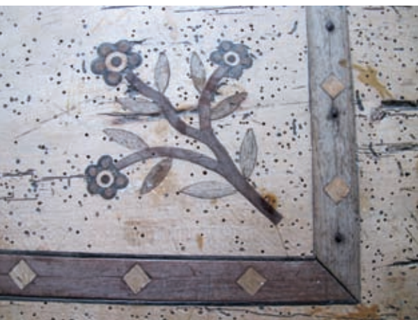
Črvojedna intarzirana miza v »hiši« je izreden primer ek kmečkega pohištva.

onstran veže pa je, nasprotno, svetla in snažna, z izvorno opravo in pohištvom s konca 19. stoletja. Posebno častitljiva je črvojedna družinska miza pod bohkovim kotom, o kateri oskrbnik meni, da je stara več kot 200 let.