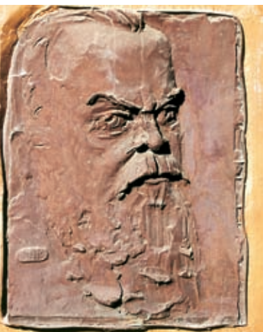
Reliefni portret Antona Aškerc, vzdian na steni ...

... njegove domačije na Senožetah nad Rimskimi Toplicami, ki je preurejena v spominski muzej.