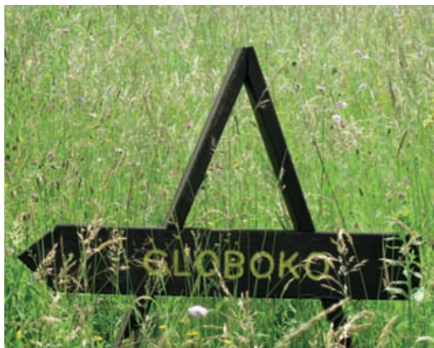
Aškerčevo pot označujejo domiselni kažipoti.