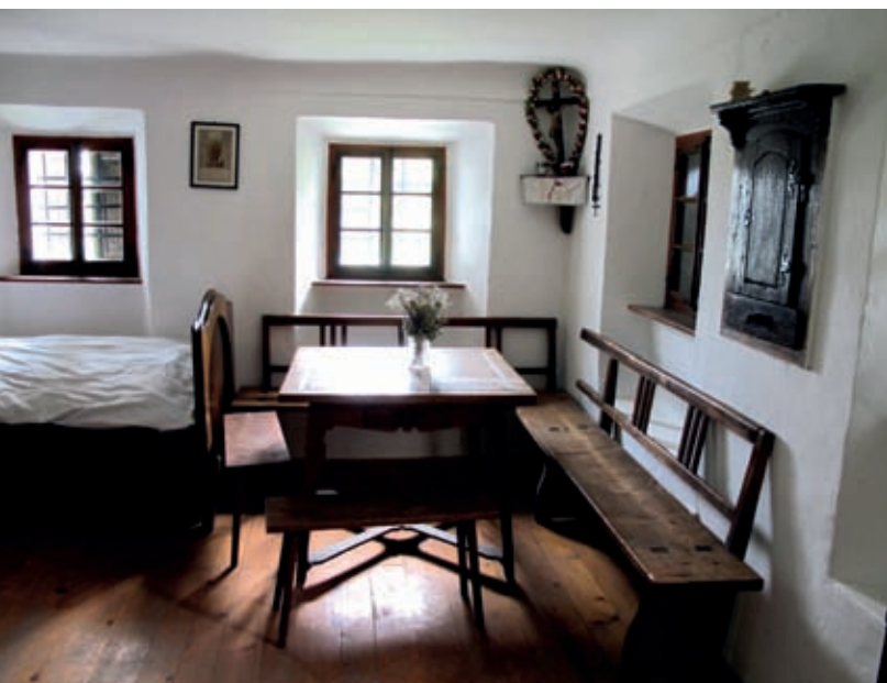
»Hiša« v Aškerčevi domačiji na Senožetah ima videz premožnega kmečkega ambienta v drugi polovici 19. stoletja.