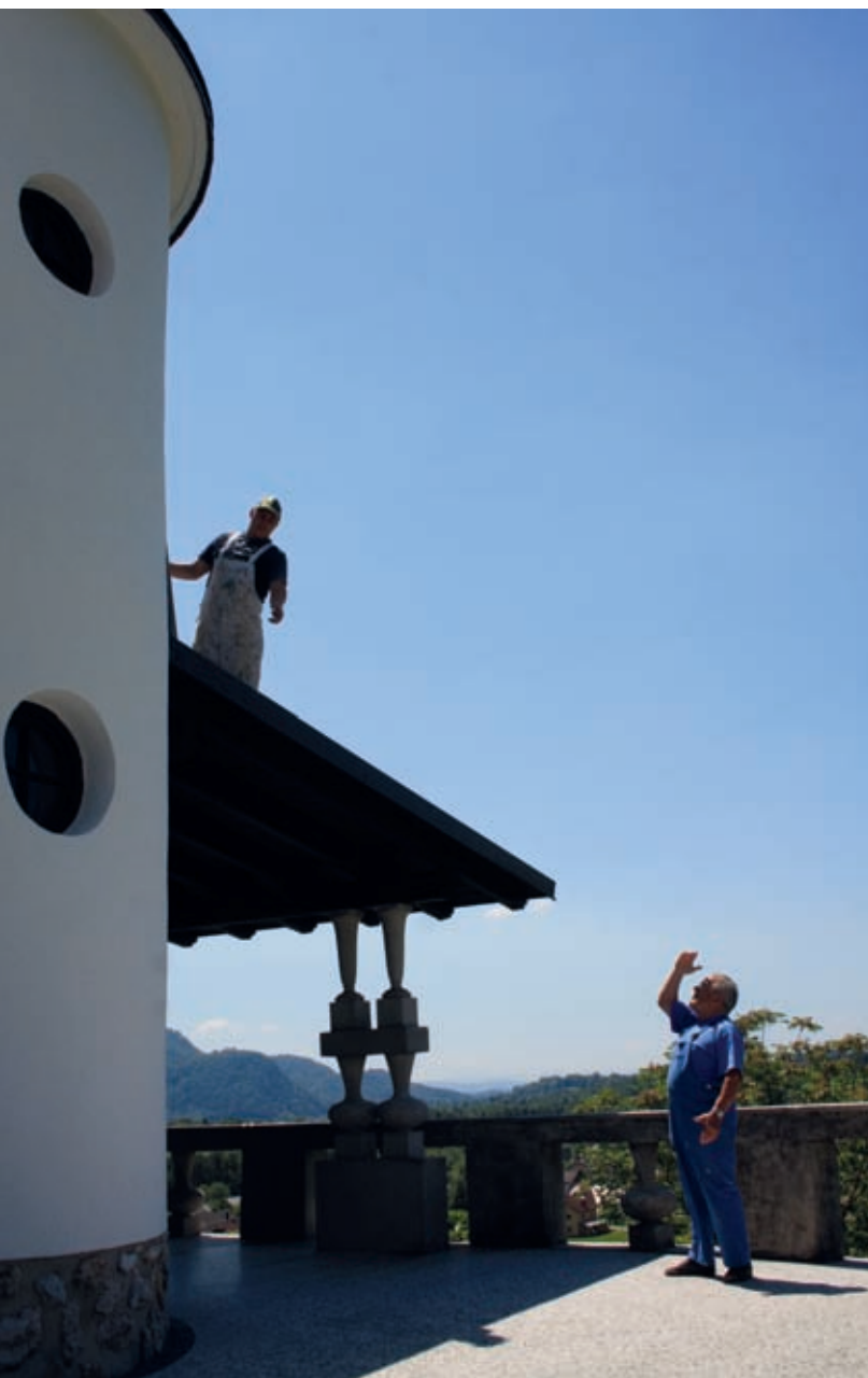
Mojstri iz Zgornjih Stranj redno skrbijo za veliko stavbno dediščino svojega kraja.

med vojno, so po vrsti ostali na papirju. Načrt za veličastni slovenski parlament, ki naj bi po prvi zamisli stal »na gori« (na ljubljanskem grajskem griču) in ki ga je naredil na povabilo takratnega predsednika parlamenta, pisatelja Ferda Kozaka, je ostal v maketi. Še en veliki koncept, ki so ga Slovenci zatajili v samih sebi. (Stožčasti stolp nad parlamentom naj bi bil visok 120 m, bil bi višji od česarkoli do takrat zgrajenega v Beogradu ali Moskvi; tega so se Slovenci ustrašili.)