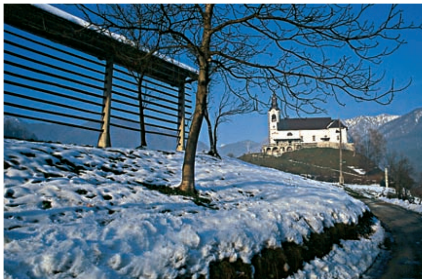
Cerkev sv. Benedikta v Zgornjih Stranjah pod Kamniško-Savinjskimi Alpami, ki nosi v sebi junaško zgodbo Plečnikove prenove kmalu po drugi svetovni vojni.

V arhitektonskem smislu smo cerkva, kakršna je bila stranjski Benedikt, premogli nič koliko. Šlo je (in po Plečniku še zmeraj gre)