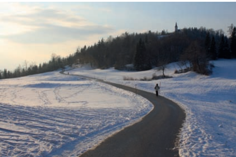
Sprehajalni in smučarski raj na območju Štefanje Gore. V ozadju je cerkev sv. Štefana, po katerem je vas dobila ime.