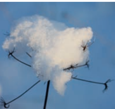
Koliko lahko nosi posušena drobna bilka?