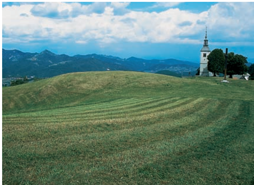
Travniki na vrhu Korena. V ozadju Polhograjski Dolomiti.

Kakorkoli že, malokje dobiš na kupu toliko izletniške ponudbe kakor na Korenu, grebenastem hribu med Horjulom in Polhovim Gradcem: v lepem vremenu bleščeč razgled po Barju, Polhograjskih Dolomitih in Rovtah, po Nanosu, Javornikih in celo dol do Snežnika; po snežnikih Julijcev, Karavank in Kamniško-Savinjskih Alp tudi. Ali lahko torej oko v enem obratu seže od severne do južne meje osrednje Slovenije? Lahko. Od blizu oko zajame hribovsko