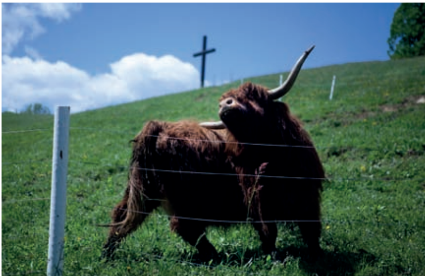
Škotsko govedo na pašniku pod korensko cerkvijo

Prastarost bi bila lahko oznaka Korena. Vršno sleme lučaj za cerkvico ima imeniten gospodovalni položaj, visok in odmaknjen nad širjavami vsenaokoli. Tudi izletnik, ki ni strokovnjak za prazgodovino, bo opazil, da je opasan s strmo teraso, sledjo nekoč močnega obzidja. Ta krožna terasa ni okrogla ali obolna, kot je to vidno pri drugih utrjenih gradiščih pri nas, ostankih naselbin neznanega ljudstva iz starejše železne dobe, temveč ima v skladu s konfiguracijo travnatega korenskega vršiča posrečeno obliko polovičnega kolobarja, kifeljca. V slovenskem arheološkem atlasu sicer ne najdemo potrdila, da gre za arheološko najdišče, vendar se je težko upreti vtisu, da je vrh