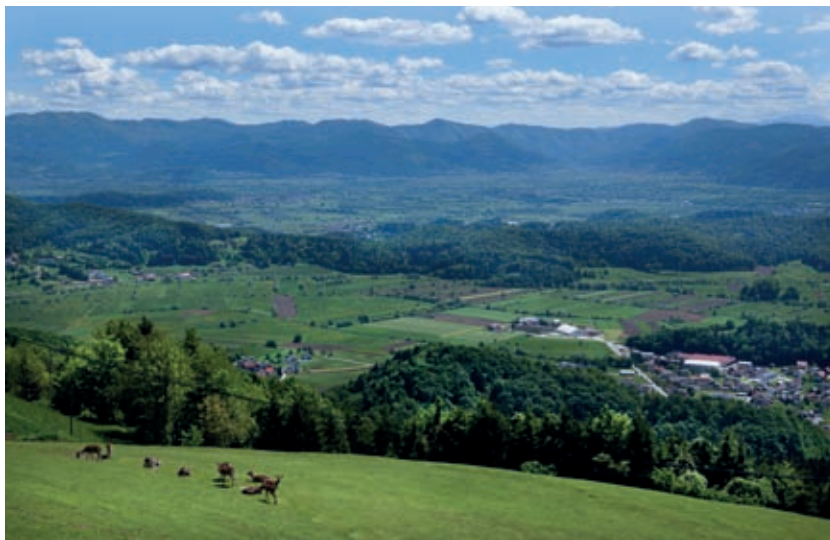
Pogled na jug, proti Horjulu in Ljubljanskemu barju

cerkvice, prazgodovinsko gradišče in dvoje častitljivih lip; pa še znamenja novejšega časa, kot sta kmetija odprtih vrat takoj pod vrhom in 12-metrski križ, imenovan svetilnik v tretje tisočletje. V časih vrhniške proge znano in priljubljeno izletišče Ljubljančanov zdaj ponovno privlači izletnike, ob njih pa vse številnejše rekreativne kolesarje.