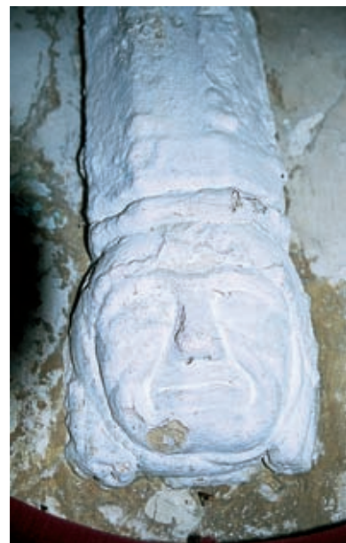
Skremžena ženska v konzoli gotskega opornika v korenski cerkvi

Podoba Svete nedelje je le delček zaklada pod šumnno, opojno dišečo lipo, delček umetniškega zaklada, ki ga skriva cerkvica sv. Mohorja in Fortunata. Zaklad se je k sreči v njej ohranil, kajti malo je manjkalo, da ni bila cerkev zaradi jeze zmagovalcev porušena. Zatišno, devet metrov dolgo in šest metrov in pol široko svetišče je danes po svoje veselo in tudi zagonetno. Z baročnih zlatih kipov pa tudi izpod beležev na zidovih mirno zrejo v nas tu pa tam odstrti svetniki, nasledniki prastarih slovenskih bogov. Kipi so sredi 18. stoletja prišli iz Polhovega Gradca, iz znane Facijeve rezbarske delavnice, medtem ko gotski mojster fresk ni znan, saj so njegove umetnine odkrite le napol. Restavratorji so ob njihovem odkrivanju zadeli ob težavo. Nekatere stene so namreč poslikane z dvema slojema fresk. Spodnji sloj je, kaže, ravno tako kakovosten kot zgornji. Ločiti fresko od freske bi bilo podobno kirurški operaciji pri ločevanju siamskih dvojčkov, zahtevalo bi veliko časa, potrpežljivosti, znanja, veččin in denarja; pa tudi širokosrčnega sprejemanja prastarosti v sedanjost in prihodnost. Vsaka nestrpnost se maščuje, prav kakor tistemu hudemu babšetu, ki se je upiralo na Koreno prinašati hrano graditeljem cerkve. Kamnito podobo njene glave je še danes mogoče videti kot konzolo pod enim od stropnih reber v prezbiteriju. Bi mi, sodobniki, bili radi tako skremženi, kot je ta nesrečnica pod svodom, prepredenim z gotskim rebrovjem? Zanamcem v zabavo?