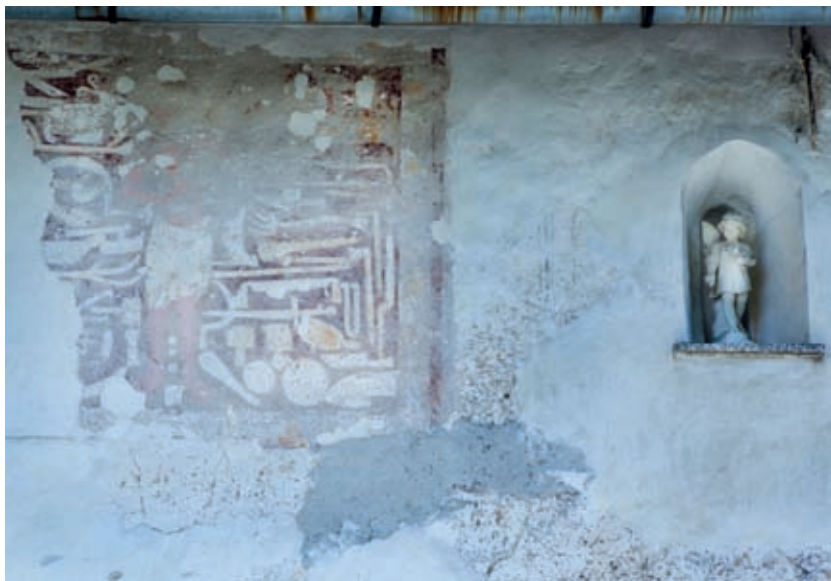
Delno ohranjena freska Svete nedelje na južni steni cerkve sv. Mohorja in Fortunata je kmetom zapovedovala, katerega orodja in orožja se morajo na Gospodov dan izogibati.

srečno zgrešile njegovo glavo. Nekaj orodja okoli njega je uničenega; drugo, nezadeto, stanovitno vztraja v prastarem poduku, vendar nemočno pred ironijo preteklosti in sedanjosti.