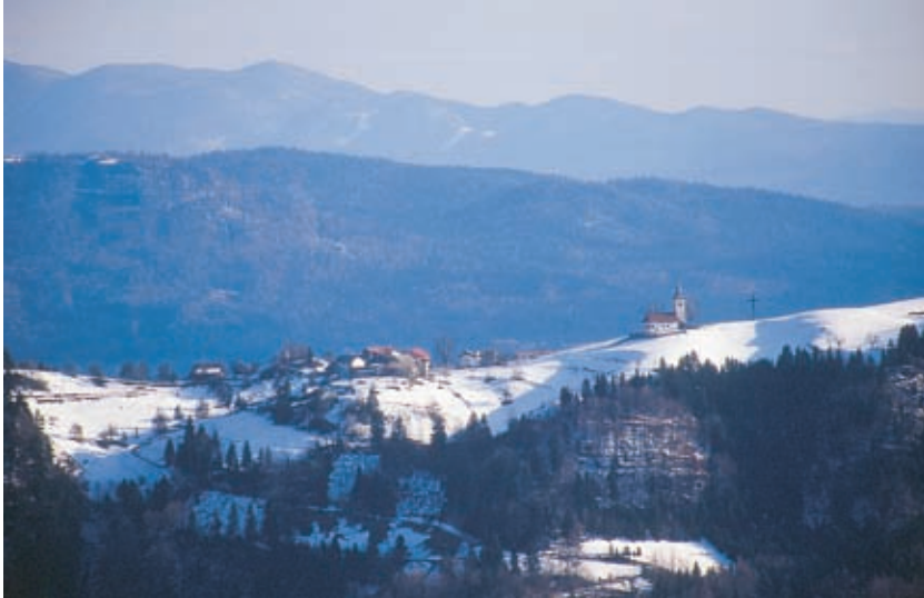
Koreno in njegova cerkev, kakor jo je pozimi videti z Grmade v Polhograjskem hribovju.

gospodar kmetije na Korenu, ki je tu doma in ki si je za štetje lahko celo življenje izbiral le najbolj oprane dni.