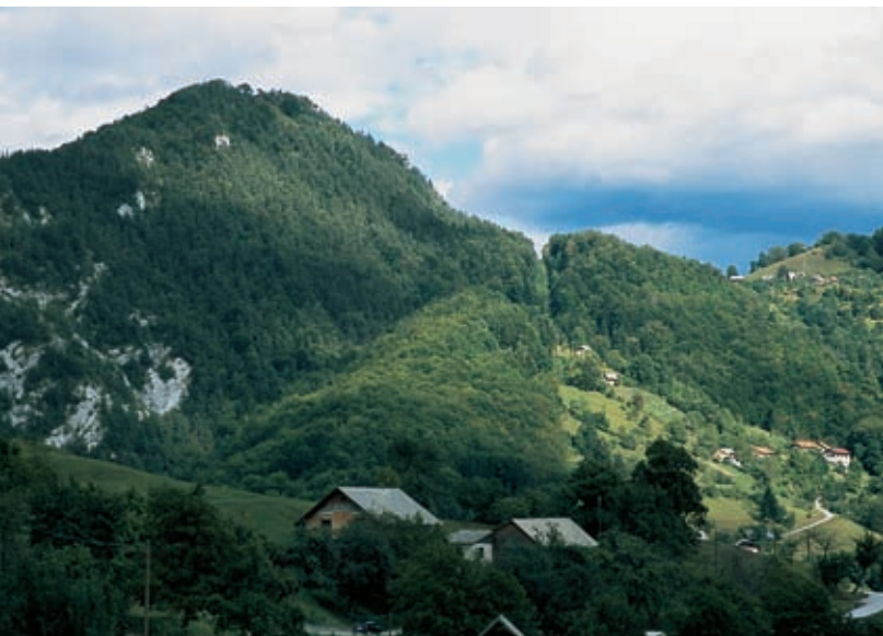
Pogled na Ostrež z jugozahoda, iz vasi Polšnik