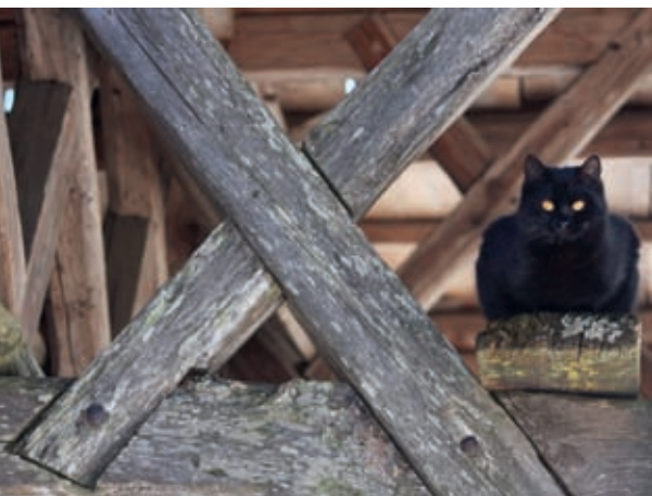
Vaški maček v Konjšici

sicer strma pot do nje tako široko nadelana? Gotovo bi bila preozka za črna volička, o katerih ljudsko izročilo poroča, da sta potegnili cerkvico iz spodnje vasice Preveg na Ostrež, ker da so bili vaščani preveč razuzdani. Takšno je pač ljudsko izročilo v krajih, kjer ležeš navzgor po vseh štirih, dol pa se spuščaš po riti; takšno čudno izročilo skesanosti. Kakorkoli že, lepo je, če na vrhu orgla sonce na vetrne piščali. Utegneš pomisliti, da je kakšen Beethovnov akord, posnet iz narave, veter odnašal dol na Konjšico v uho staremu dirigentu ob njegovi zadnji uri.