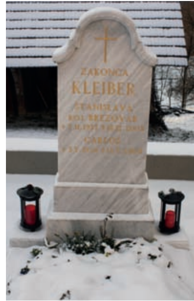
Grob zakoncev Kleiber na vaškem pokopališču sredi Konjšice

Sredi vasi je danes na ogled spominska soba Carlosa Kleiberja. V njej se lahko obiskovalec seznanil z njegovim življenjem in delom. Kleiberju je bila zoprna vsakršna publiciteta, ki spremlja slavne osebnosti, in v svoji skromnosti bi bil najbrž zadovoljen muzejčkom, kakršen stoji danes sredi Konjšice. Ženino vas je imel rad in tudi njeno sorodstvo se mu je priljubilo. Morda bomo ljubitelji klasične glasbe lahko kdaj prišli na Konjšico poslušat posnetke njegovih plošč in koncertov. Vsi veljajo za