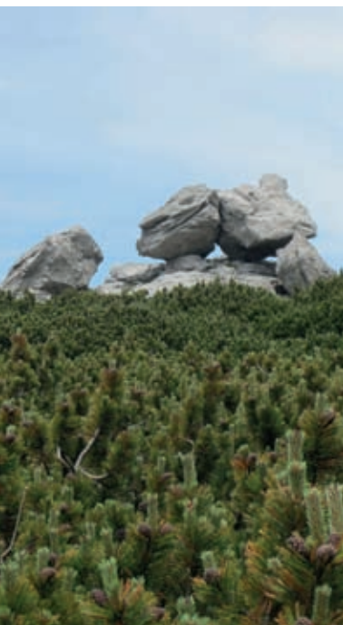
Osamelci iz odpornejših apnencev na Malem Snežniku

štiri ure do vrha. Pot pelje skozi najlepše gozdne sestoje, pri čemer pa je treba skrbno paziti na rdeče-rumene markacije E-6. Avtomobilskim planincem je pač treba priporočiti cesto iz Ilirske Bistrice do Sviščakov (1242 m), kjer je gostilna. Od tam naprej jih bo zaradi zdrapanje ceste morda bolela duša za avtomobil. Če pa bodo stisnili zobe nad volanom, se bodo pripeljali do parkirišča na koncu te ceste, od koder je na vrh manj kot ura hoda. Vmes bodo seveda morali na rob ceste odrinjati pravoverne planince, ki