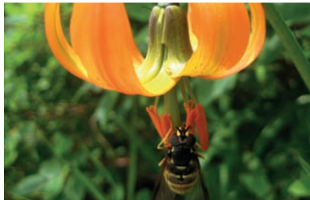
Čebela se je lotila nabiranja cvetnega prahu na kranjski liliji. Kako visoko je letela na Snežnik? Skoraj na 1700 metrov.

Snežnik je poln neznanih glasov živih bitij. Ni treba, da bi si v obuvalo nasuli praprotnega semena, če bi jih hoteli razumeti. Le umirite se in poslušajte okolico tako dolgo, da zaslišite sami sebe. Morda boste tedaj začeli razumevati tudi živali. Kočljivo sožitje živih.