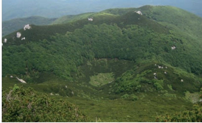
Velika mraziščna vrtača pod Malim Snežnikom

boste dihali ozon s snežniških smrek. Vendar boste v glavnem naleteli na njihove iztrebke, na živalce pa najverjetneje ne, razen na bežečo rogato divjad. Seveda v snežniški svet vodi volčja sled. Nekoč so vdirali v ovčje obore in poklali več, kot so zmogli snesti, zato so ovčarji pripravljali volčje jame, v katere so nastavljali žive ovce, da so z meketanjem privabljale volkove. Tako so jih poskušali iztrebiti. Se pa tu širi kajpak tudi medvedji svet. Ni redko, da ga kdo sreča, vendar pa, kakor je največkrat sporočeno, medved hitro odhlača mimo prestrašenih planincev ali gobarjev. Leta 1874 je neki delavec blizu Kobiljega žleba ujel medvedjega mladiča, zaradi česar ga je napadla medvedka. To je bilo zadnjič, da je zver na Snežniku raztrgala človeka.