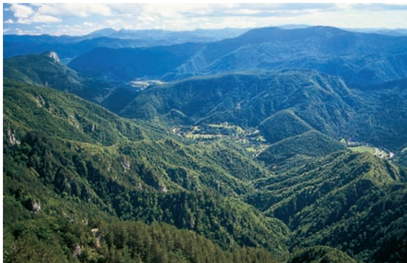
Pogled s Kobile na Kolpo pri Bosljivi Loki, Mirtovičih in Kuželjski steni

Kot se najbolj znajde v kotu, kadar nezaznavni veter dopusti oblakom, da sedejo na njegov gozd in se pomešajo z izhlapevanjem dreves. Kadar narava leže v svoj zapečkarški kot: ko z nekaj sape odstre Kolpin kanjon globoko v njegovem zelenilu, zraven pa tisti stalni šum z jeza pod Damljem preobleče v škropotanje dežja. Ko se ne počutimo potisnjene v njen kot, ampak v njeni sredici, posebej še tisti, ki smo priveslali po reki in se ustavili v tem Kotu, potem ko smo za nekaj ur povezali del reke z delom svojega življenja.