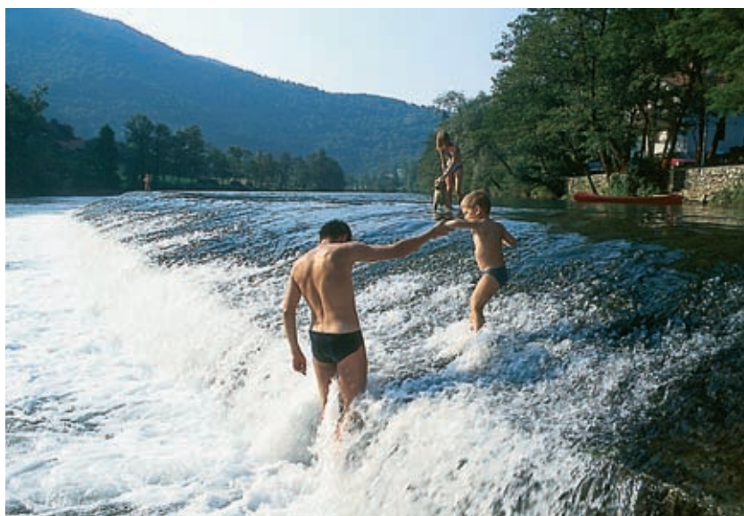
Kopalni užitki na jezu čez poletno Kolpo ob Madroničevem mlinu v Prelesju.

V Sloveniji imamo štiri vasi s prelestnim imenom Prelesje. Od tega se tri vasi – pri Šentrupertu na Dolenjskem, pri Gorenji vasi na Gorenjskem, pri Litiji v Zasavju – imenujejo Prêlesje. Vse po vrsti so tako lepe, da si zaslužijo svoje ime, če je izpeljano iz besede prelést (na primer dekliška prelést ali prelést pomladnega cvetja). Četrta vas s tem imenom pa leži v dolini naše najdaljše mejne reke, pod Starim trgom ob Kolpi, in se imenuje Prêlesje. Ali to ime izvira iz besede prélest, ki v staroslovanščini in ruščini pomeni čar, draž, zvijačnost lepote, v stari, opuščeni slovenski rabi pa je označevala nekaj podobnega: prevaro, zvijačo? Slovenski slovarji ne odgovarjajo na to uganoko; v njih besede prelesje ali prelestje sploh ni.