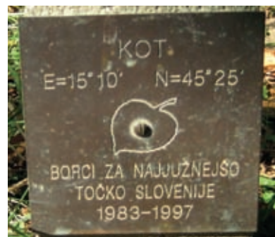
Spomeniška tabla v Kotu pri Damlju

To še ni mrtev kot: šest zidanih hiš, šest ostarelih prebivalcev, en napol potopljen čoln, ki ne vozi več otrok v šolo na hrvaško stran. Nihče ga ne potrebuje. Otrok v Kotu že dolgo ni. Mlade imajo le studenčki, ki se kotalikajo izpod Sebetiha. A radi presahnejo. Eden med njimi, ob cesti iz Damlja v Kot, imenovan Župnikov, je nepresahljiv in zmeraj na voljo obiskovalcem, ki za dan ali dva na divje taborijo ob Kolpi. Izletniki se lahko približajo reki, kjerkoli si zaželi, če jim to le dopuščajo zaraščeni bregovi. Kadar je nizka, se Kolpa pod Kotom skoraj ne premakne, ker jo zadržuje jez dva kilometra niže v Damlju. Pod to vasjo, ki čepi na visokem robu, kjer se široka in suha dolina prekotali h Kolpi, je urejeno kopaljšče. Jez ob dameljskem mlinu, ponekod že zdrt, se dotika prodnatega rečnega otoka, na katerem se družno sončijo kopalci s tega in onega brega, kar je živ dokaz, da je na mejni reki za vse dovolj prostora. Bog ne daj, da bi se še za ta otok vnel kakšen zanikrn meddržavni spor.