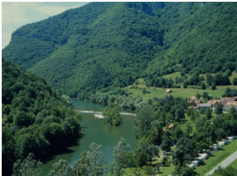
Pogled na Kolpo, ki jo v Prelesju seka jez Madroničevega mlina.

V tem mlinu so jeseni 1943 prenočili slovenski odposlanci, preden so se odpravili naprej v Jajce, kjer so potrdili meje avnojske Jugoslavije. Udeleženec v koloni, Edvard Kocbek, se v Listini spominja postarnega, molčečega in razbrazdanega mlinarjevega očeta, ki mu je izrekel svojo neizprosno resnico: »Živali se pripravljajo na zimsko spanje, človek pa na novo divjanje.« Kocbek nato ubere teman lirični ton: Kolpa je odsevala v snežni mesečini, šumenje bližnjega jeza je z nastopom noči začelo vedno bolj prevladovati. Na naši strani so se sklanjale nad vodo velikanske vrbe, iz reke se je