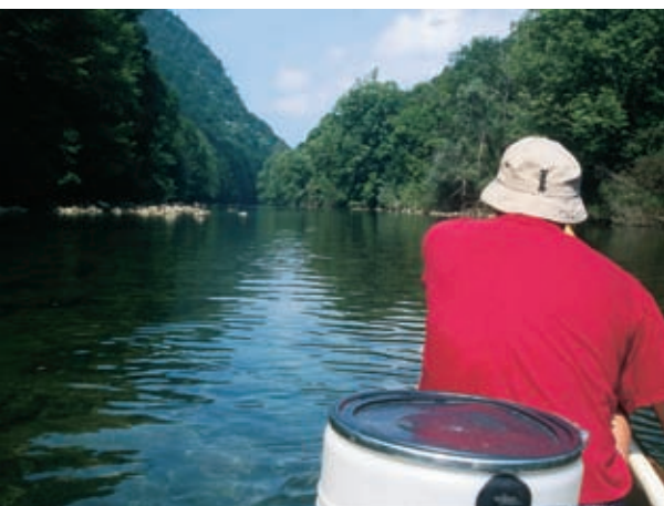
Avtor v kanuju napreduje proti Kotu pri Damlju, najjužnejši točki Slovenije.

To res ni mrtev kot: ima veliko naplavljenih skal in na jezove nanesenih kamnov, ki so pokriti s temno zelenim spolzkim mahovjem. Ima velike liste lapuha in zelene preproge malih zeli, ima milijone bisernih kapljic na listih, ima presojno zeleno vodo, podojeno s številnimi podzemeljskimi izviri. Ima mahove in alge, ki odmirajo v apnenčastih oklepih. Ima velikanske silhuete bukev, katerih krošnje skrivnostno izginjajo v meglici. Ima padla drevesa, ki iz reke molijo le še krone svojega izruvanega koreninja. Na njem čaplja nepremično preži na nepredvidno ribico. A ribe mirujejo med skoraj okamnelimi porušeni debli. Le srebrn lesket trebušov izdaja njihov nemirni strah. Čaplja, ki smo jo splašili, odleti dostojanstveno, zamahujoč s perutmi, skozi džunglo prepletenega rastlinja in kamenja, kakor s pahljačama, ki hladita usnulo princeso. Odleti v svoj kot. Narava je kot, ki se nenehno umika na vse strani neba, brez meja. Le mi imamo Kot, kjer je meja, ki je brez prelesti.