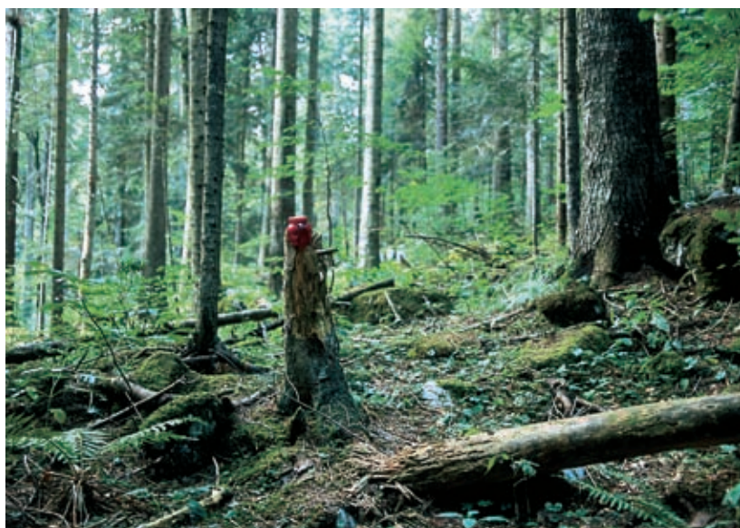
Gozd pod Ogenjco. Na kraj strašnih dogodkov pride kdaj kdo prižgat svečo.

Vendar nad Ogenjco, nad temi slovenskimi Termopilami, srce še zmeraj vzdrhti. Skale v zelenju in sredi njih jama tragično oživljajo temeljno človeško vrednoto – svetost življenja; kakor da hočejo spregovoriti s pesnikom Edvardom Kocbekom: In tèma se zgane / in z duhom utrne / bolečine plamen, / in zemlja obstane / in mi zibel zagrne / z večnostjo, amen.