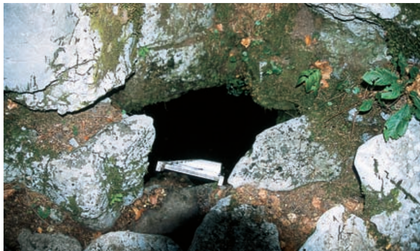
Skoraj navpični vhod v jamo Ogenjco, kjer se je med roško ofenzivo poleti 1942 pred italijansko vojsko skrivalo petnajst ranjenih partizanov.