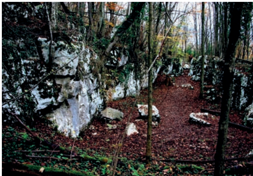
Mitrej je posebno vabljiv jeseni.