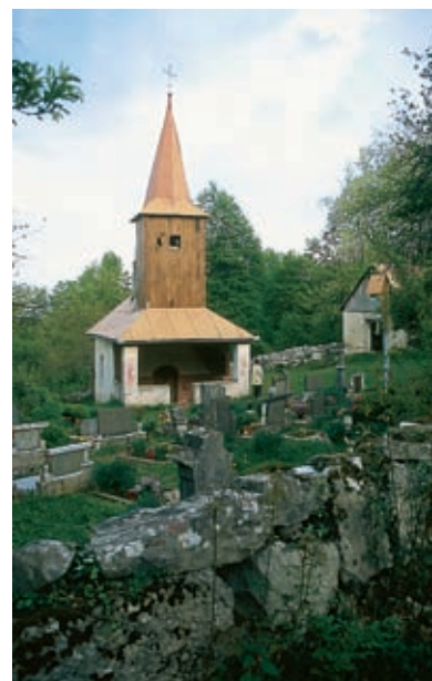
Cerkvica sv. Jurija s pokopališčem stoji čisto blizu mitreja.

V pobočju nad mitrejem stoji cerkev sv. Jurija, obdana s kamnitim obzidjem. V listinah je prvič zapisana 1526. leta, vendar je, sodeč po gradbeni zasnovi, veliko starejša. Jurij ni daleč od Mitre, ubija zmaja namesto bika. Je zavetnik kmetov, popotnikov, priprošnjik za lepo vreme, torej za sonce. Zavetnik vse Bele krajine je, čaščen ne le 23. aprila, na jurjevo, ob jurjevanju, ampak čez vse leto. Čaščenje junakov, ki ubijajo temo in zlo, ne bo nikoli zamrlo.