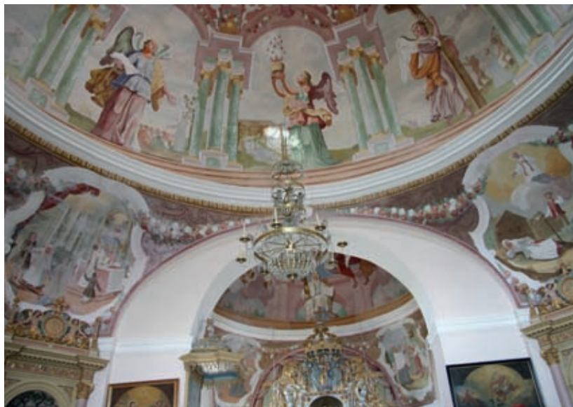
Frančiškova cerkev na Veseli gori ima tudi veselo poslikano notranjost, zlasti pod kupolo.

Tako je to v umetnosti: slikarja Frančiška niso pustili k Frančišku na Veseli gori, smel pa je k Mariji na Žalostno goro. Ali je tu moral naslikati kaj manj veselega? Naslikal je svete podobe, kakor je vedel in znal: na vesel način, ker je bil po duši vesel človek. Tako kot je vesele freske naslikal nekaj let pozneje na Štajerskem, na Sladki Gori. Zato se žalostnega imena mokronoške božje poti ni treba bati. Tudi tu boste naleteli le na vitalni, življenja se veseleči barok. Vrnite se na Veselo goro,