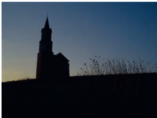
Cerkev sv. Barbare vrh čudovito razglednega hriba Okrog

Na ta odročni Okrog se niti ni treba posebno potruditi. Končno parkirišče je slabih deset minut hoje pod vrhom. Če vas najprej vleče v naročje kmečke turistične kmetije, imate prosto cesto do njenega dvorišča. Kogar pa kliče lep razgled in si hoče razjasniti srce in oko z lepoto narave, naj pusti avto že pri Škrljevu; uro hoda bo imel na Okrog. To pot si radi izbirajo za svoj izlet šolarji za praktični pouk o pojmih: dolina, ravnina, kotlina, gričevje, hrib, potok, vinograd, delo v vinogradu, čebelnjak, sadovnjak, delo na polju, hlev, kmečko orodje in kmečki stroji, domače živali, gozd, rastlinstvo in živalstvo v gozdu, gozdni sadeži, vrt, delo na vrtu, naselje, vrsta naselij, odvisnost vasi od mesta in mesta od vasi, trg,