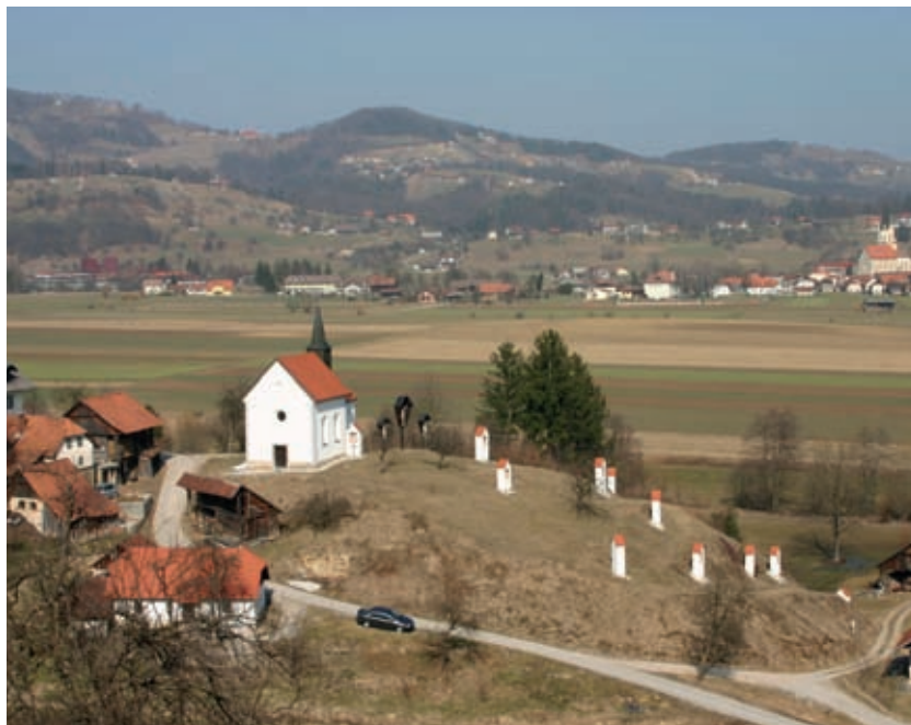
Z Vesele gore oziroma iz vasi Brinje je lep pogled po Mirnski dolini. V ospredju vidimo brinjski križev pot, zadaj desno pa Šentrupert.

baročno razpoložen; ceste se vijejo v navidezno nelogičnih okljukih – saj odsevajo stare lastninske in služnostne pravice. V noben kraj se ne pripelješ naravnost. Tako ob ozki cesti z Vesele gore pri zaselku Ravnik naletimo na grad Škrljevo. Tu se že širi duh novih lastnikov. Gradič, razvit iz srednjeveškega stolpastega dvora, na pogled imeniten, solidno ohranjen, dolgo ni bil naseljen niti vzdrževan. Obnavljal ga je premožni mož, ki je tod blizu doma.