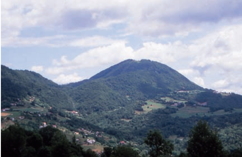
Priljubljena pot na Kum pelje tudi z jugozahodne strani, iz vasi Podkum in Mali Kum.

so vam pljuča doli v revirjih malo počrnela, si boste tu oddahnili. Gledati visok trboveljski dimnik kot velikansko sivo iglo globoko pod seboj je pravi (in privoščljiv) užitek!