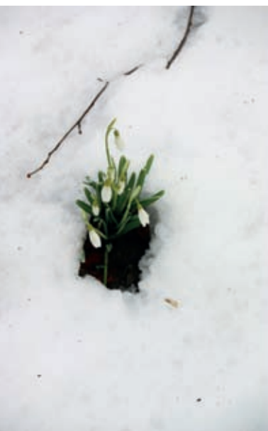
Prva rast v sencah pod grajskimi razvalinami

Kaj pa zvonjenje? Ne komu, ampak – kje zvoní, kaj zvoní? – vas zanima, kajne? V spodnji jami, kjer po večjem deževju bobnijo brzice in slapiči – tam zvoní. Ali si je mogoče ogledati te »zvonove«?