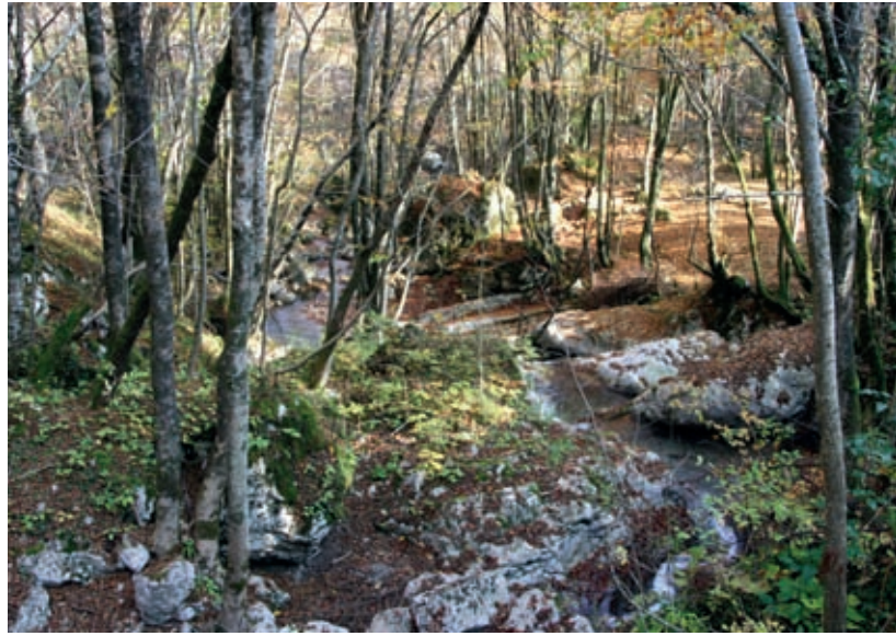
Potok Radulja dolbe svoje korito v zatišni okolici Klevevža.

Ta sveža, vesela voda raduljasta! Senčen in globok je njen okljuk, s katerim oklepa sivo zidovje starega plemiškega gnezda. Dolbe draslje v triadni apnenec; polkroglaste so in res podobne odtisom bajnih ritnic ajdovskih gospa, ki so se umivale v Radulji. Ponekod voda v drasljah ponika z globokimi hripavimi šumi, da se ti zazdi, kot bi slišal tožbe starega odsluženega trubadurja s Slik z razstave Modesta Musorgskega, ki mu niso odprli grajskih vrat; potem pa rečica spet premaguje strmec v številnih slikovitih slapičih, ki so kot krila davnih gospodičen. In tako dan in noč, leto in dan, večna bajka. V zemeljski skorji pod nami nekje blizu bije ognjena žila planeta in ogreva vode. Preden se Radulja umiri in razlije k staremu grajskemu mlinu, s strani priteče še en klevevški termalni izvir. V bazenčku brbotajo topli mehurčki, v mrazu se iz njega kadi. Po nekaj litrov vode na minuto vre z dna, vendar je nekoliko hladnejša kot v bližnjih Šmarjeških Toplicah, od 21 do 25 stopinj Celzija. Kljub temu si je bazenček prislužil ime Klevevške toplice. Ne bo vam ravno vroče, če se okopate v njem, bo pa mlačno, vsaj gorkeje kot na zraku. Že Valvasor se je kopal v njem, tisti veliki mož, ki je svoji radovednosti prodal dušo in telo. Pomolite v to vodo vsaj svoj prst.