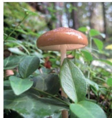
Predel na severozahodni strani Klevevža je odljuden. Redke gobe imajo mir pred nabiralci.