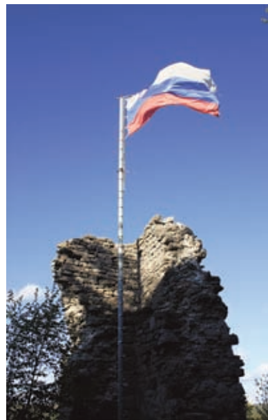
Razvaline višnjegorskega gradu so postaja na Jurčičevi poti.

Od gradu se Jurčičeva pot, enako mehka in prijazna, vendar nič več strma, vzpenja naprej proti vasi Pristava pri Višnji Gori. Tu je videti nekaj ostankov starega kmečkega gradbeništva in tesarstva. Tabla z napisom »Dobrodošli na Polževem« izletniku oznani, da je stopil na hribovito kraško planoto, visoko od 400 do nekaj več kot 600 metrov, ki zajema ducat vasic in zaselkov in ki je to ime, Polževo, dobila šele v novejšem času, kajpak po višnjanskem polžu. Planota je kraljestvo sprehodov, samotnega užitekarenja v naravi, gobarjenja, kolesarjenja ... Kot na velikanski in zaobljeni zeleni preprogi se pojavijo tudi obdelana polja. Mimo nesrečnega hotela Polževo, ki kar naprej išče sposobnejše lastnike, in po vzponu po poseki, namenjeni nekdanjemu smučišču, pridejo pohodniki do vrha planote, do cerkvice sv. Duha, na sredo Jurčičeve poti, na njen najlepši del. Od Duha je