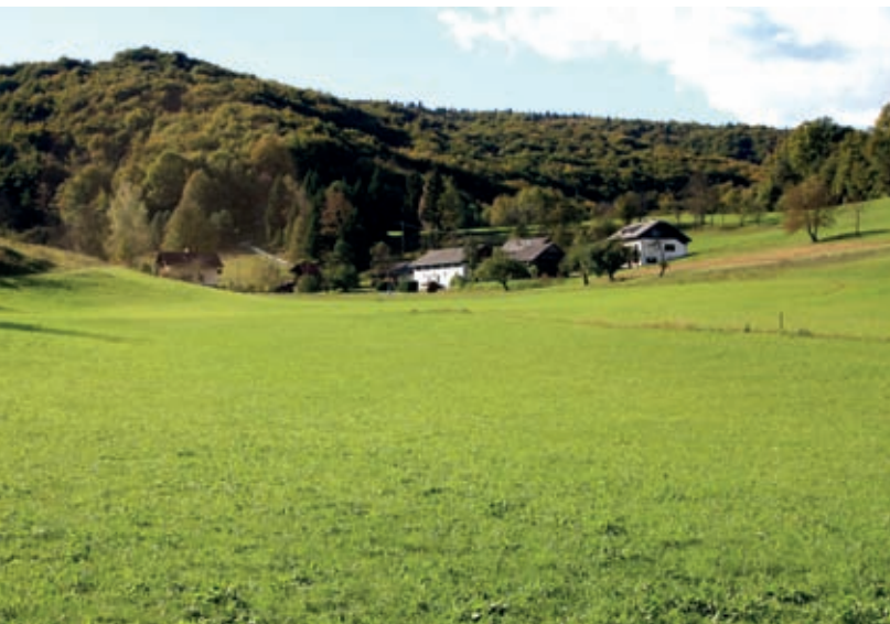
Tu je še v 19. stoletju stal grad Kravjek, v romanu Deseti brat preimenovan v Slemenice.

Od Roj, prizorišča Jurčičeve povesti Grad Rojinje, se pot spusti v dolino, ki je bila prizorišče romana Deseti brat. O Kravjeku, gradu, ki ga je Jurčič preimenoval v Slemenice, ni več sledu. V tej deželici lahko s poti, ki si kmalu izposodi asfaltno cesto vse do Muljave, opazujete sodoben slovenski kmečki svet. Kravjek je bil v Jurčičevih časih še lep grad, last nemške družine Otto. Pred 150 leti so zvezde, ki jim je bila slovenska kultura mila, v to omikano družino za domačega učitelja pripeljale bistrega, domišljije in kmečke srčne kulture