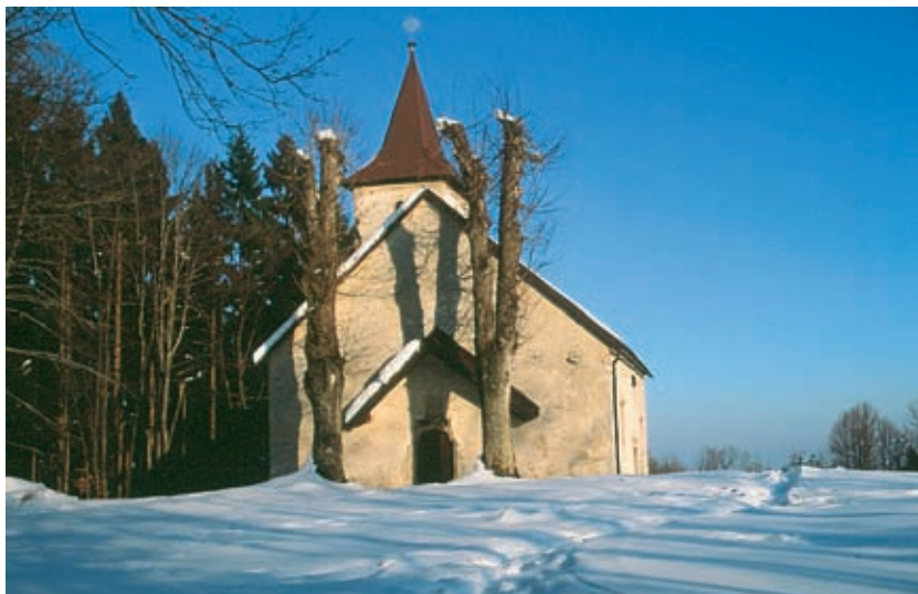
Cerkvica sv. Duha nad Polževim, najvišja točka Jurčičeve poti

v krogu videti alpske vršace, Krim, Snežnik, Trdinov vrh in Kum, skoraj pol Slovenije. Ob veliki panorami pa je na ogled tudi lep detajl: čudovit gotski portal na cerkvi sv. Duha, ki ga je v srednjem veku izdelal neki ljudski klesar. V vasi Male Vrhe, ki je od cerkve oddaljena dva kilometra, lahko povprašate za ključ; tako si boste lahko v cerkvi ogledali tudi nadvse zanimive konzole pod gotskimi rebri, na katerih so upodobljeni obrazi lastnikov gradu Roje. Ta grad, ves razvaljen, prepleten z robidovjem in srobotino, sicer čaka na nadaljnji poti proti Muljavi. Presunjeni od občutka prazničnosti in lepote, ki ga odseva prostor okoli cerkve na vrhu Polževega, boste z mehke travne ravni videli, se vam bo zdelo, kar celo Dolenjsko. S »štacjona«, kakor Višnjani kličejo svojo železniško postajo, je do Duha poldruga ura hoda. Opravili ste planinsko turo! Naprej bo pot lažja.