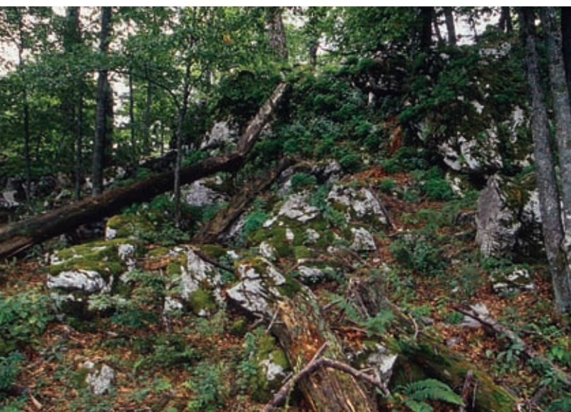
Ovršje Goteniškega Snežnika prekriva pragozd.

odlikuje po debelih in visokih drevesih, katerih korenine se kakor kremplji oklepajo skal. Kremplji ne popustijo, niti kadar drevo podre vihar. Hočejo, da pragozdno drevo živi še drugi del življenja, po svoji smrti, ko postane prijazno gostišče za številna mrčesna bitja, ki tudi rada živijo.