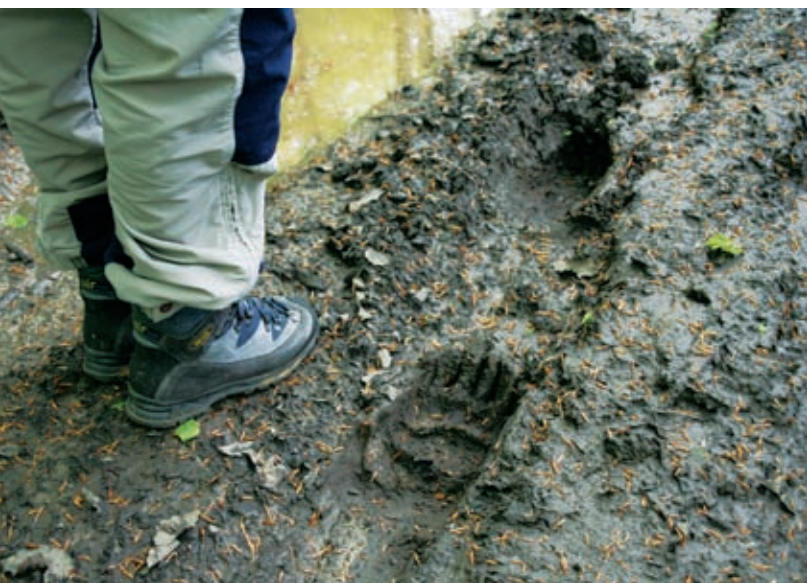
Tu je šel medved.

kaj vse zmore ukoreninjenost: da tone in tone težka drevesa stojijo pokonci, da prehranjuje to drevje, da ohranja rodovitnost tal in da daje življenjski prostor različnim živalim. Kakšen procesor! Ali je človek že odkril kaj podobnega, tako popolnega, samo sebe obnavljajočega?