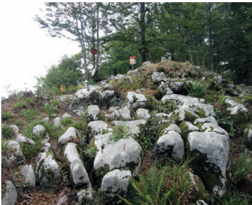
Vrh Goteniškega Snežnika

Dolgčas, res? Cesta skoraj doseže rob pragozda, enega številnih pragozdov, ki že kakor pike na leopardovi koži prekrivajo Kočevsko. Goteniški pragozd prekriva vrh gore in je po tem edinstven. Tudi sam vrh, ki je velikanska kamnita grmada, se