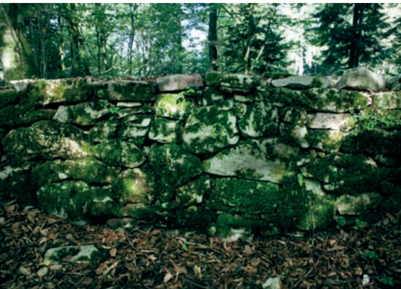
Del ohranjenega obzidja, ki je obkrožalo Cvinger.