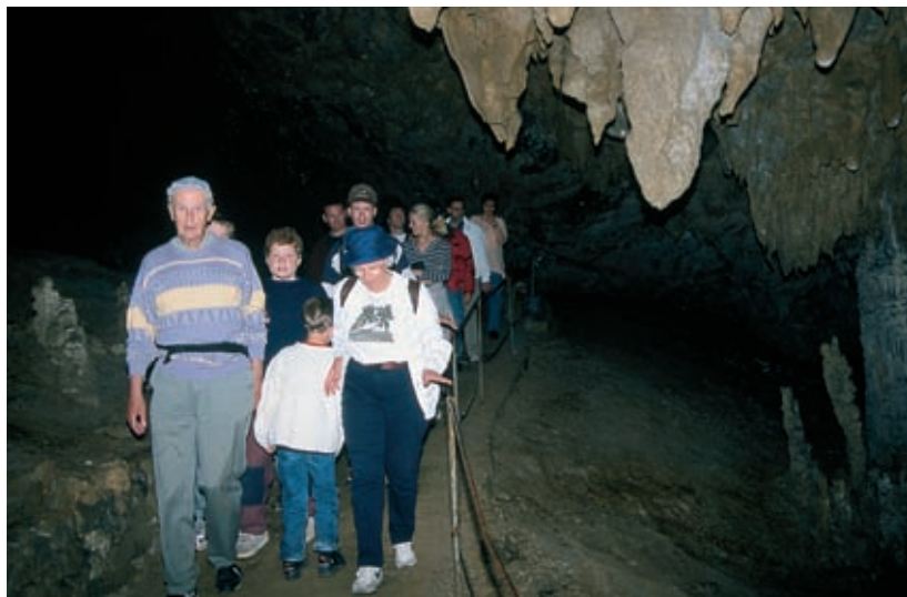
Dedek in babica peljeta vnuke po pravljичni podzemski deželji

Zgodovina je tu izpričana nepretrganih 10 000 let. Človek na Škocjanskem živi nevarno, v kočljivem ravnovesju s prepadnim in votlikavim površjem, a ravno zaradi tega v zgodovini tudi varno. Naravne ovire so najbolj omejevale vdor sovražnih oblegovalcev, še posebno v rimskih in srednjeveških časih, ko se je bilo treba braniti pred Turki. Razgibano kraško območje je z izvorišči zemeljskih energij navdihovalo tudi pogsanske svečenike, da so ob jamah