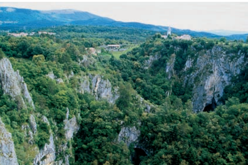
Mala in Velika dolina, nad njima vas Škocjan, pod katero se skozi sistem jam prebija reka Reka.

nekaj starosvetnih hiš, vrtov in za opuščeno pokopališče. Prebivalci so se v glavnem odselili. V Škocjanu živi še peščica ljudi, v bližnji Betanji pa kmetuje še četvero družin. Nekatero podrtije obnavlja država, nekatere vikendaši. Nekaj stavb raste na novo, tudi v turistične namene. Obiskovalcev je v regijskem parku vsako leto nekaj tisoč več, zmeraj pa krepko čez 60 000. Škocjanske jame so krona kraškega turizma, še zlasti odkar so bile leta 1986 vpisane na Unescov seznam svetovne naravne in kulturne dediščine. Razlog te priljubljenosti ni samo narava, ampak tudi načrtno razvojno delo parkovnega vodstva.