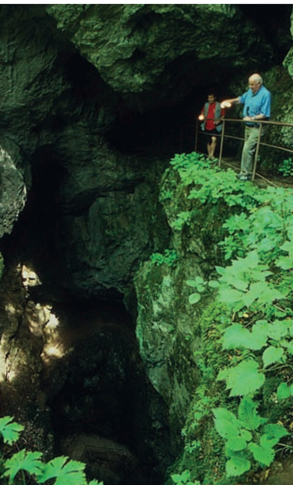
Na zaviti vhodni poti v jamo Dimnice

sv. Špirita, kar je bil lep primer marksističnega zlitja materije in duha.