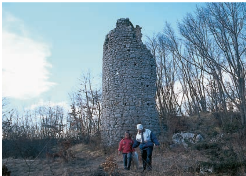
Ostanki stražnega gradu Tabor med slepima dolinama ob vaseh Brezovica in Odolina

pesniško razviharjenimi vejami vidimo tudi pred sv. Martinom v Slivju in sv. Mavrom na Rjavčah. Čisto na koncu brezoviške doline, kjer z Brkinov priteka Ločica, nekdo goji konje. Konjušnica je tudi v Odolini, sosednji dolini, kjer ponika Brsnica. Spomniš se številnih sledov konjskih kopit po gmajnah, med rujem, brini in šipki. Kajpak tu nihče več ne potuje na konjih. Sledovi ostajajo za turisti, ki jih je po svoji deželi vodil podjetni domačin. Peljal jih je na primer na sleme med Bre-