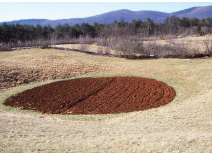
Plitva vrtača s plodno njivo v slepi dolini pri Brezovici