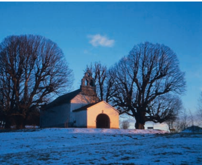
Cerkvica sv. Mavra v Rjavčah, obdana s stoletnimi lipami

po kateri od njih spuščamo z razvodnega slemena Brkinov, če sledimo še kakšnemu potoku, imamo občutek, da smo v pravi dolini. Nenadoma pa nam pot zastavi skalni zatrep; pod njim vodotok ponikne.