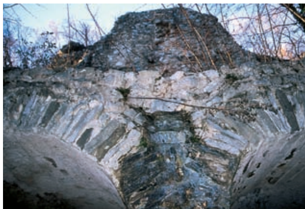
Oboki rimskega vodovodnega stolpa pod Školjem sv. Pavla

Od železne brvi, narejene iz podolgovatega dela starega parnega stroja, jo uberite skozi deber bistrega Vrtovinščka, vsaj do 3-metrskega slapu, ki skrit pod Školjem sv. Pavla označuje geološko nenavadnost te osamele grebenaste gmote. Trdo, strmo skalovje, ki je tako podobno trdnjavskim zidovom, deli Vipavsko dolino na dva dela. Poglejte dobro: v stenah je ostalo marsikaj zidanega. Ob koncu antike, med 4. in 7. stoletjem, je na Školju v resnici stalo utrjeno mesto Rimljanov, ki so se iz svojih vipavskih selišč zatekli nanj, da bi se rešili pred plenilskimi hordami barbarov. Da so jim končno morali popustiti, dokazuje železna puščica s konico v obliki lastovičjega repa, o kateri arheologi, ki so jo izkopali na Školju sv. Pavla, domnevajo, da je sled Avarov ali Slovanov. Ta lastovka umirajočemu Rimu ni prinesla pomladi.