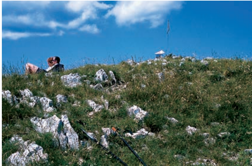
Prijeten počitek na vrhu Kuclja. Razgled sega čez Kras na Jadran v Tržaškem zalivu in v furlansko ravnino.

V družini kosmatih in sivo zgubanih čavenskih fantov pa je zrasel tudi nenavadno čeden, v gorsko travo oblečen, a zmeraj lepo obrit in odišavljen brat Kucelj. Že ime pove, da ni ravno strm ali visok, vendar je samosvoje umaknjen povsem na rob planote, tako da gosposko dvignjen vse vidi, sam pa je od povsod viden. Pod njim živeči Vrtovinci so na njegovih goljavah stoletja imeli poletno pašo. Zdaj se čred na Čavnu nabere komaj za manjšo stajo, zato se njegova pobočja in ovršje kar šibijo od obilja odrešenega rastja, planj travne zelenine in pisanega gorskega cvetja, še zlasti spomladi in v zgodnjem poletju. Še kakšno desetletje