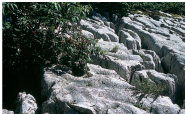
Škraplje na Čavnu