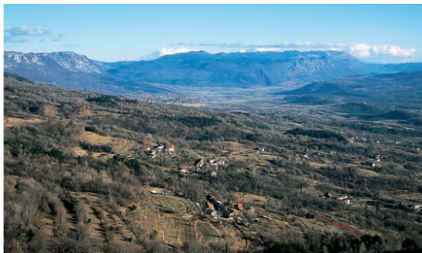
Pogled s Školja sv. Pavla proti zgornjemu delu Vipavske doline in Ajdovščini. V ozadju rob Trnovskega gozda in Nanos.

Kmalu za slapom boste stopili na staro antično pot in po njej prišli do ostankov vrat poznorimskega kastela, vklesanih v skalo. Vidni so žlebovi podbojev in kolesnice v kamnitem kolovozu. Za vrati se proti jugu ulekne prostrana travna ploščad, velika približno hektar. Grbine na njej kažejo, da je prst prekrila številne hiše, utrdbe in svetišča. Ob prepadnih stenah na robih ploščadi poteka obrambni zid iz lomljencev, zidan z dobro ohranjeno apneno malto, ponekod visok več kot dva metra. Na južnem vznožju tega gradišča, tik pod skalnim previsom, stoji turris aquae , masiven, mogočen rimski vodni zbiralnik, na prvi pogled še danes podoben obrambnemu stolpu, kar je prvotno gotovo tudi bil. K stolpu se spuščajo vsekane stopnice. V velikanski jašek stare cisterne peljejo še ene stopnice, vse do podesta,