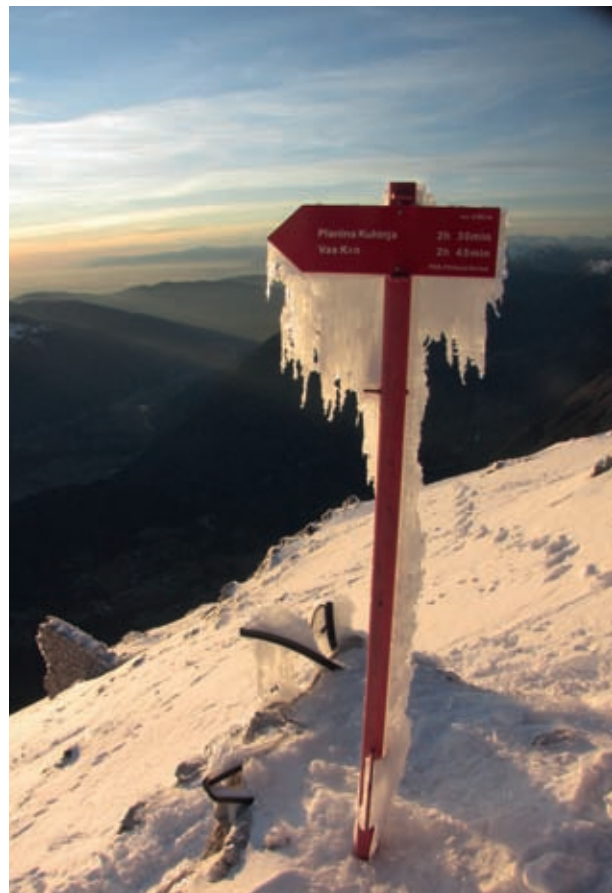
Planinski kažipot pod Krnom pozimi

Pastirsko življenje Leskovce se je preselilo na nižjo Planino Kuhinjo. Tu boste ovohavali zoreči sir tolminc. Če vas bo premagala lakota, jejte svežega po malem! Izvedeli boste, kako deluje pašna skupnost, kaj počneta dežurni mlekar in odpašnik, kaj so rabote in druge nenavadne podrobnosti stare pastirske kulture, morda še iz megalitskih časov. Oglasil se bo neki davni Simon; izročilo izgubljenega in znova iskanega raja: Živejem po pameti zdravi, / za muhe mi ljudske ni mar.