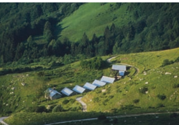
Planina Zaslap, blizu katere je bil odkrit skrivnostni kamniti krog.

Lužniško jezero je pravi kraj, ob katerem človek spet začuti nedolžno, ob človeškem zlu nejeverno goro, planinski raj, ki še zdaj in morda na vekomaj raztreščen prosi za milostni spomin, kot bi zanj nemara prosil ranjenec, prerasel s še zmeraj odprtimi brazgotinami gore, naphanimi z železjem in zdrobljenimi kostmi. Vojaki so sovražili ta raj. Pesnik Giuseppe Ungaretti (1888–1970), prestrašeni soldat na italijanski strani, je zmogel korak naprej od sovraštva: Vso dolgo noč, vržen zraven razmesarjenega tovariša, z njegovimi usti spačenimi, obrnjenimi k polni luni, z nabrekliimi žilami njegovih rok, prodirajočimi v mojo tihoto, sem pisal pisma, polna ljubezni. Še nikdar se nisem tako oprijemal življenja. Ali ta strastni zapis ne govori o pošastni stiski srca? Ali lahko kaj prispeva k spoznanju, da je tudi sovražni vojak zmeraj in povsod le ubogi človek, vreden toliko kot mi?