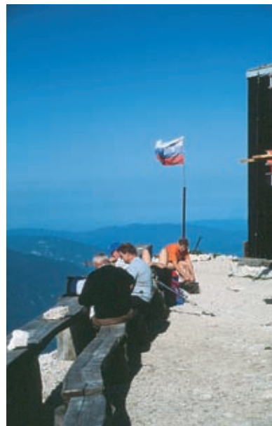
Pri Gomiščkovem zavetišču pod vrhom Krna