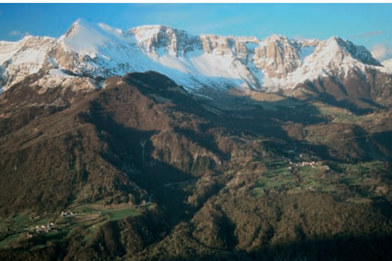
Gorska veriga nad vasmi Libušnje, Vrsno in Krn: Krnčica, Krn, Batognica, Masebnik, Rdeči rob in Stador.