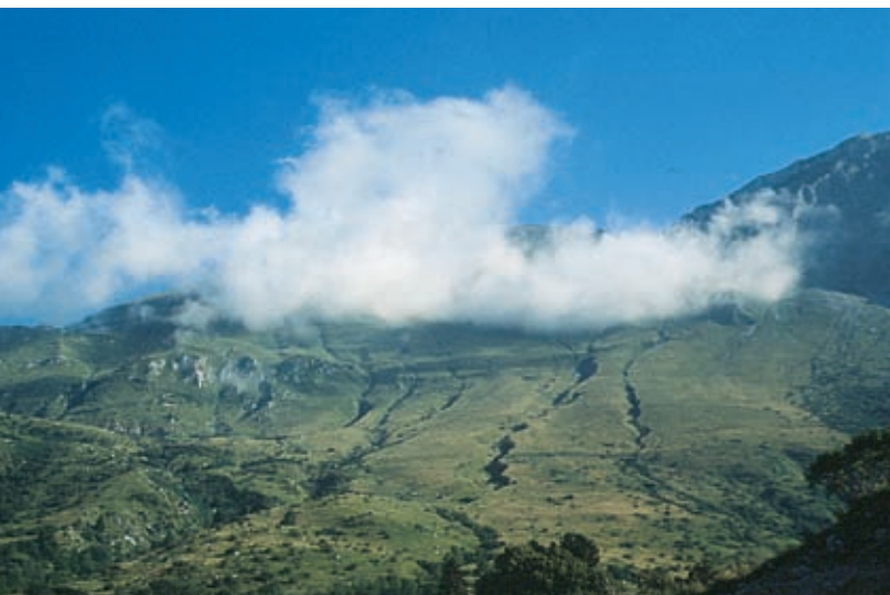
Planinski raj pesnika Simona Gregorčiča na travnatem zahodnem pobočju Krna

Krn je tudi debela knjiga planinskih, zgodovinskih, planšarskih zgodb. Pod njim je v šestdesetih letih 19. stoletja kot deček pastirjeval Simon Gregorčič, kasneje zaradi blagozvočnosti svojih pesmi imenovan goriški slavček. Široka, lepo obokana glava Krna ter njegovo čokato in zbrzdano telo, na prisojni strani ode-to v amfiteatralno širok zelen plašč, sta vzgajala njegov bistri pogled za lepote narave; in čut za podkrnske pastirske planine