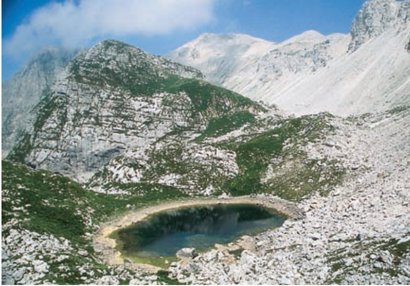
Drugo krnsko jezero ali Jezero v Lužnici nad Planino Leskovca. Zadaj Vrh nad Peski.

Ali ne kliče k svetemu pravilu: ne stori drugemu človeku tistega, česar se bojiš, da bi on storil tebi?