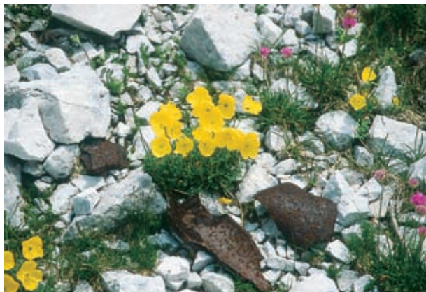
Smrtonosni ostanki granat iz prve svetovne vojne in nežna cvetana v krnskem pogorju