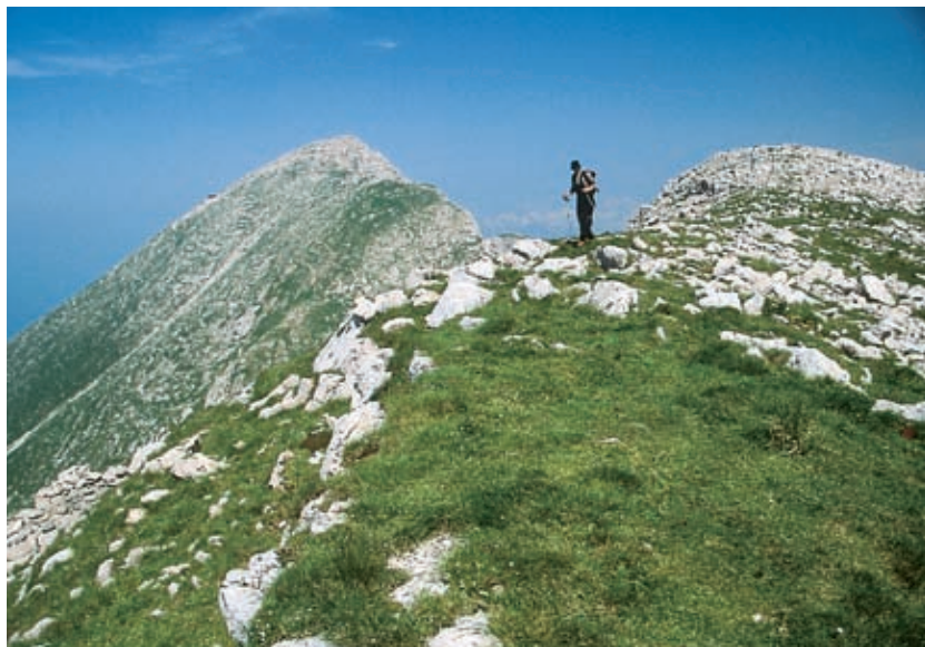
Planinec na vrhu Batognice, ki je bil leta 1917 podminiran. V ozadju vrh Krna.

Italijanskim alpinom je že 16. junija 1915, dobra dva tedna po začetku sovražnosti na soški fronti, uspelo zasesti vrh Krna, potem ko so na njem presenetili in pobili polpospalo, na smrt utrujeno madžarsko posadko, nevajeno gora. Avstro-ogrsko poveljstvo se je pač zmotilo o naravni neosvojljivosti Krna in je na vrh poslalo stražit honvede . Nekateri Italijani so še danes razvneti zaradi te (redke) zmage na Soči, zato boste okoli vrha našli ostanke vencev in trikolor, sledove vsakoletnih proslav ... Proslav česa? Nečloveškosti vojne, krvačenja za puhel blišč in zločinski pohlep?