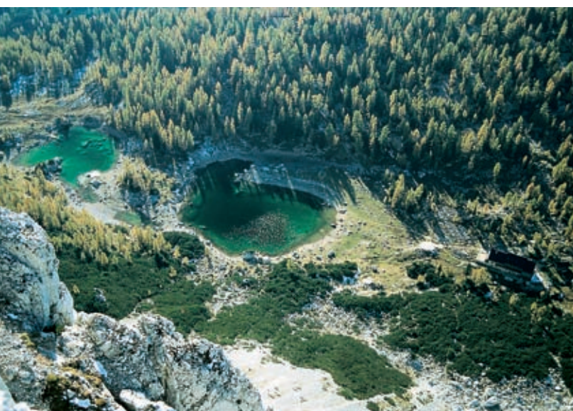
Pogled s Tičarice na Dvojno jezero

se z zelenomodrimi očmi ozirajo nazaj h goram, kakor bi vedela, da lahko odtekajo le navzdol in da bodo iz svojih temnih porodnih strug kmalu odbučala v orjaški slap Savica. Izjema je pri tem samo prvo jezero, imenovano Jezero pod Vršcem (1991 m), ki se ledu in snega praviloma znebi šele na začetku julija, zato ga pomladni pohodnik težko opazi, čeprav je razmeroma veliko (110 m v dalj, 80 m v šir); odteka v Sočo in Jadran. Med tem jezerom in naslednjim, Mlako v Laštah, ki