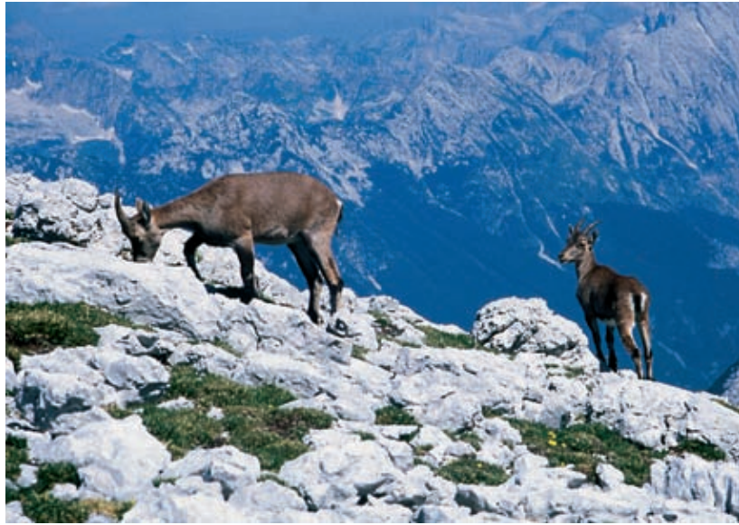
Vrt divjih koz na območju Triglavskih jezer

Vede, naj poskušajo biti še tako ljubeznive, ne pojasnjujejo tega vprašanja. Na zanimiv možen odgovor pa sem naletel v neki knjigarini v Katmanduju, kjer sem v knjigi nepalskih pravljic bral o himalajskih krivopetnicah. Tudi tiste so živele na višavah, imele bajeslovno