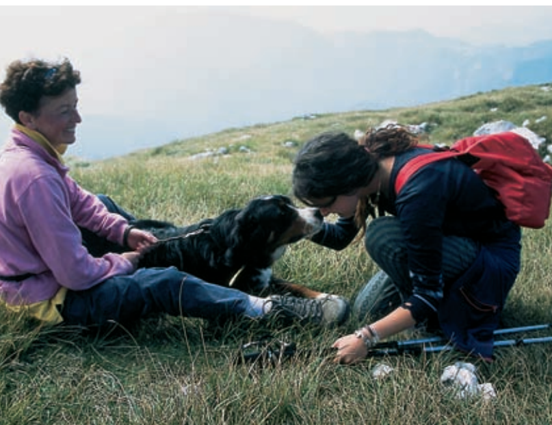
Prijazno srečanje v bohinjskih gorah