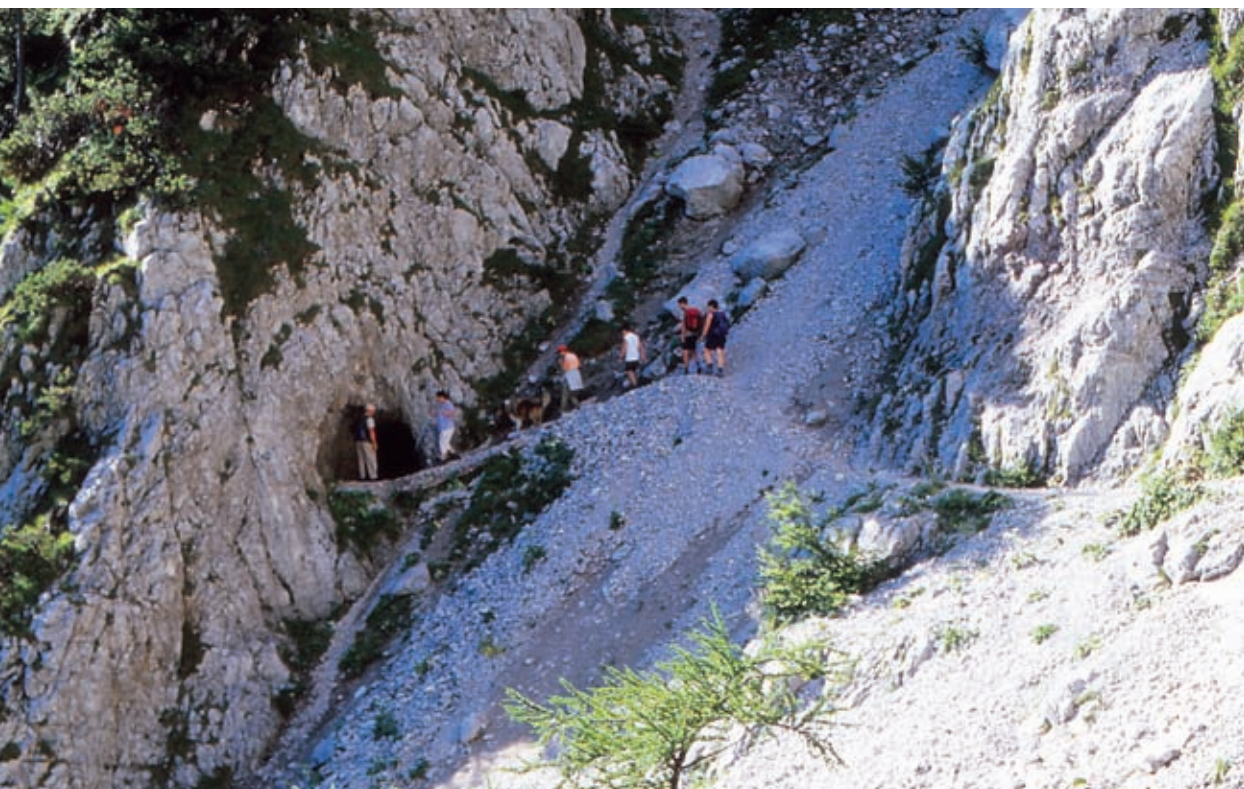
Bornov predor na vzhodnem pobočju Begunjščice, na poti z Zelenice na Preval, kjer se začinja strm vzpon na vrh.

po mejnih grebenih in vrhovih drugih karavanških gora, kot so Stol, Vrtača in Košuta. Dokler ni bilo sproščenega obmejnega režima, je bila Begunjščica, edina velika karavanška gora znotraj državnega ozemlja, kulturna gora zagledancev v staro, dinozavrsko obsežno gorovje med Julijci in Grintovci. Prečenje njenega grebena z obiskom vseh treh njenih vrhov je slovelo kot eden najlepših, najbolj razglednih gorskih »sprehodov« pri nas.