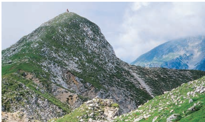
Na vrhu Begunjščice

Hudih strmin na pogled ni zaznati, zato se Begunjščica kakšnemu planincu zazdi kot hitro in celo lahko dostopna gora; da je torej