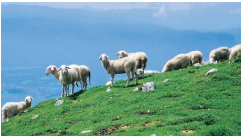
Prijazna paša na južnih strmalmih Begunjščice

Planinci, ki teže hodijo navzdol kot navzgor (pustili pa so avto na Ljubelju), se »zabijanju kolen« lahko nekoliko izognejo, če se z Velikega Vrha napotijo na Zahodni vrh in s transverzalne poti pol ure pred Roblekovim domom zavijejo na desno, na severno pot, ki se spušča k Zelenici in naprej na Ljubelj. Časovna razdalja je komaj kaj daljša kot povratek na Preval in po Bornovi poti, pohodniško zadoščenje pa večje, kajti planinec bo goro obhodel in s tem spoznal prisojne in osojne strani te gorenjske lepote.