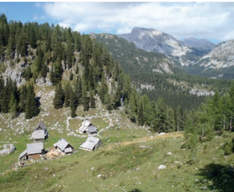
Planina Viševnik. V ozadju Debeli vrh.

naglo, kakor je rada razposajena in lahkomišelna mladost. Jerca je prizvanjanje posameznih tropičev komaj slišala. Preveč vsakdanje ji je postalo življenje v planini. In pa – vsa je bila zaverovana v stran proti Belim glavam in še naprej proti Tičarici in Kopicici. Oči si je bila zaslonila z roko in preiskovala je s pogledom skalovje in meli, jase in ruševje, pa nikjer ni mogla izslediti Hribarjevega Petra.