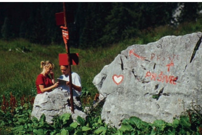
Med bohinjski pastirskimi planinami so razpredene prijazne in dobro označene planinske poti.

se steza postavi pokonci, kar nič ne de; hodite po vrhnjem robu strmih pečin nad jezerom. (Na desni strani se ponekod približate tudi cesti, ki z Vogarja pelje do obračališča pod Voketom. S tega obračališča je do vrha Pršivca manj kot za poldrugo uro strme poti. Ampak tega v tej knjigi niste prebrali. Bolje je s pešačenjem od Vogarja ravno prav ogreti kosti in mišice za končne strmine.)