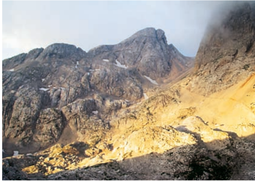
Pot, ki se čez Hribarice spušča k Tržaški koči na Doliču, nad njo Mišeljski konec.

Mišeljski konec pada na severno stran proti planoti Hribaric precej strmo, zato se je treba vrniti na izhodišče na grebenu, od koder je – zdaj pa pogumno po severni strani – zlahka najti prehod na »avtocesto«, ki se čez Hribarice spusti h Koči na Doliču. Tu bo pač treba prespati (da bi morebiti naslednje jutro »upičili« še Triglav). Srčno vam želim manj togotno noč, kot sem jo preživel v Tržaški koči. Koča je bila pravi babilon jezikov, (pre)polna utrujenih planincev, ki so si želeli spodobne družabnosti, branja in mirne večerje, pa se je v njej kot pogostokrat pod Triglavom prikazala tolpa objestnih slovenskih mladcev, tulečih pavijanov, ki jim še preko polnoči ni bilo dovolj pijače, vmes pa so gazili in bruhalo po spečih; ženska oskrbniška ekipa jih ni (z)mogla spraviti v red, ker jim je pač prej že opazno pijanim prodajala dobičkonosno vino in žganje. Triglavsko pogorje je bilo zmeraj tudi svojevrstno prizorišče zlorab naših vrednot.