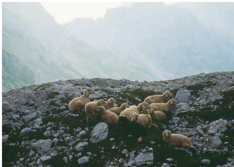
V pričakovanju nevihte pod Mišelj vrhom