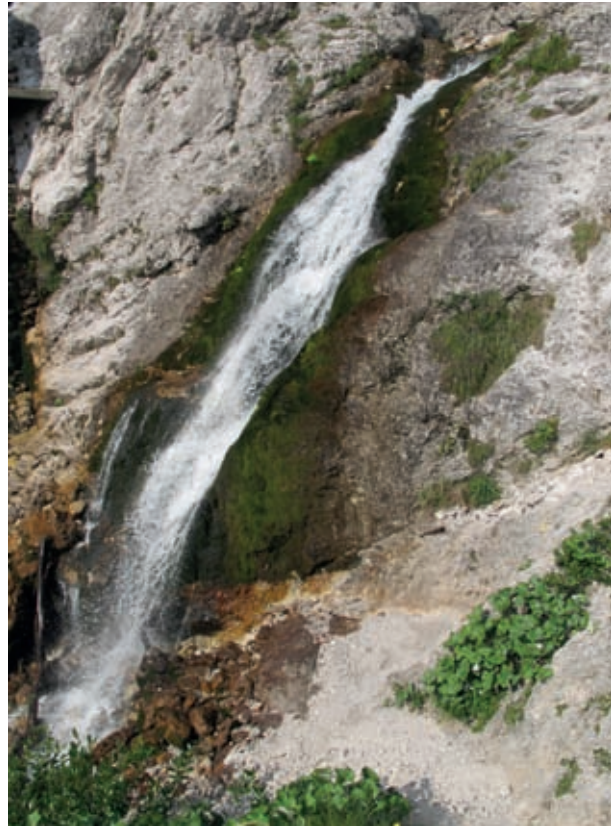
Slapičje Nadiže takoj pod izvirov