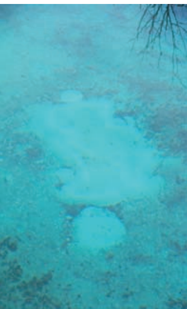
Vrelec v Zelencih