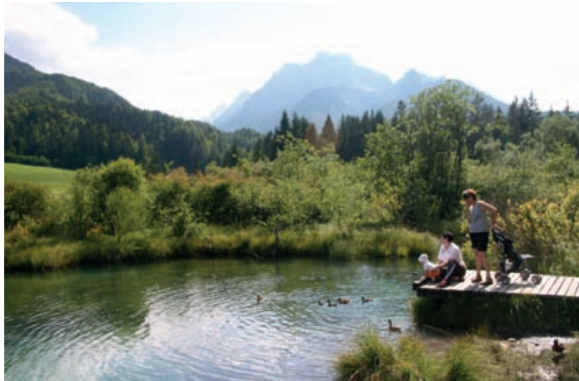
Zelenci v Zgornji Savski dolini, v ozadju veriga Ponc