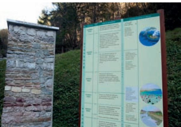
S stebrom in z napisno tablo geologi obiskovalcem pojasnjujejo vse globine zemeljske zgodovine v Dovžanovi soteski.

Štégovnik je druga in drugačna zgodba. Domačini mu pravijo Štégounek. Ime bi utegnulo priti iz stare besede šteklovnik ali šteklača, ki pomeni palico s kovinsko ostjo. Ko na vrhu te gore opazuješ od strel okleščena drevesa, se ti res lahko zazdi, da stojiš na konici, ki se sicer nikamor ne zadira, razen v nebo, zato pa se na njej rado iskri od udarcev iz nebes. Iz tega sledi, da se na Štégounek podajajte samo v lepem dnevu, po možnosti že zgodaj.