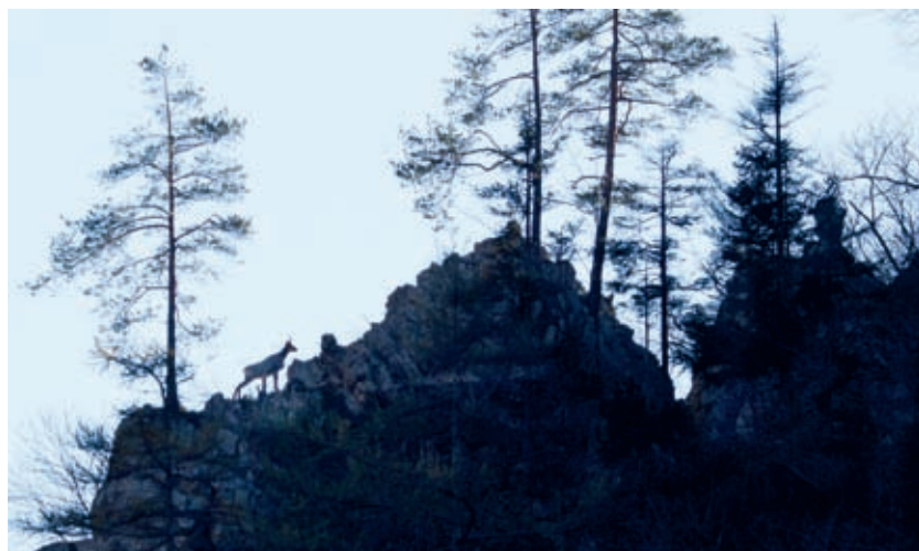
Gams na skalnih rogljih nad desnim bregom Tržiške Bistrice