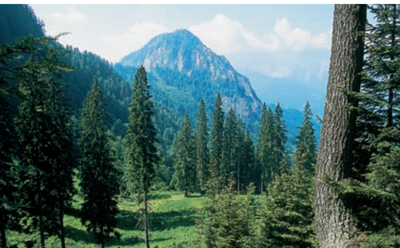
Pogled na Štégovnik s Planine Javornik

Mati narava je okoli Štégovnika nasula še obilo drugih zgodb. Ena je povezana s planinstvom. Od pašnika, ob katerem lahko pustite avto, pelje pod Štégovnik ena najbolj udobnih, prijetno zavravnanih in senčnih poti v naših gorah. Gora, ki je z leve strani planincu ves čas pred očmi, s svojimi sivimi strminami napoveduje, da bo na koncu treba nemara še plezati. Sledi presenečenje: ves čas varna, lepo markirana pot iznenada zgine v prepadni steni. Zato je treba malo poplezati in se celo poplaziti skozi dva od štirih preduhov, ki luknjajo Štégovnik na njegovem levem grebenu. Na svetlo se zrinete na severni strani gore. Onstran se kot registri mogočnih orgel nizajo vrhovi 10 km dolge Košute, pred planincem pa vstaja le steza po nekoliko strmejši gruščnati grapi. Vzpon ne bo daljši kot 15 minut. Na vršnem