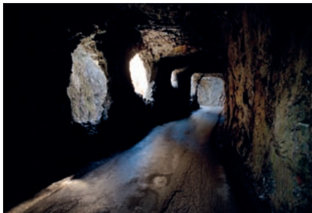
Drzno speljan cestni predor nad levim bregom Tržiške Bistrice