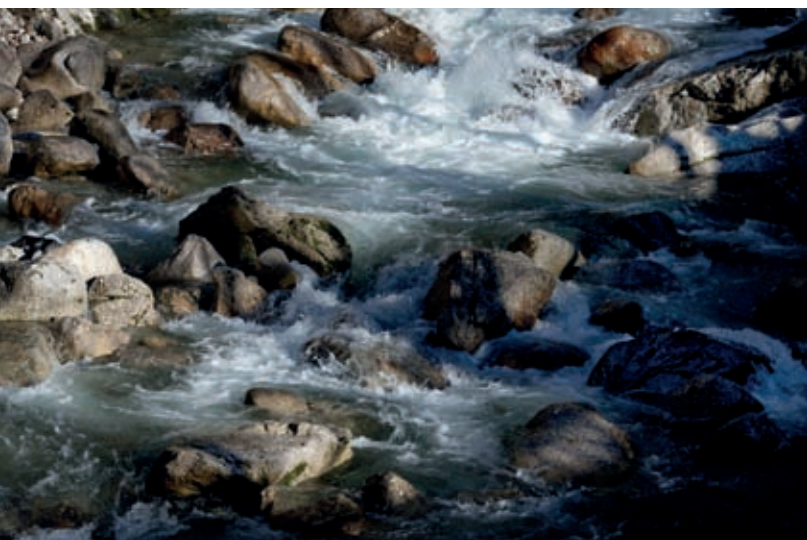
Brzice Bistrice se prebijajo med skalami kremenčevega konglomerata.

mineralov in fosilov. V soteski je društvo postavilo opazovalne točke oziroma informativne table, ki poučijo obiskovalca o geoloških in paleontoloških značilnostih, ki jih vidi ob poti. Posebno zanimiv je geološki steber, ki so ga geologi postavili ob strugi Bistrice in v katerega so vzdane soteskine kamnine po svojem časovnem sosledju. Zraven je enako visoka napisna tabla, ki te kamnine določa po rudninski sestavi in časovnem zaporedju. Od